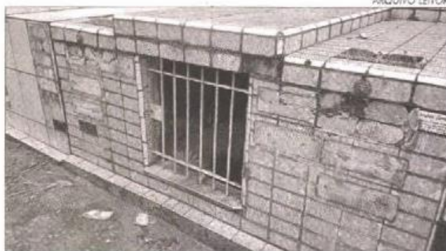
Placas furtadas de túmulo no Quarta Parada

O Serviço Funerário do Município informou que sobre o boletim de ocorrência é importante reforçar que, embora os cemitérios municipais tenham administração pública – e portanto devam garantir a limpeza e manutenção do local – os túmulos são concessões e por isto os concessionários (quase sempre são membros da família cujo túmulo pertence) precisam fazer o B.O em caso de furto em seus jazigos. Foi ressaltado que os administradores, quando informados por funcionários ou jardineiros e construtores, também se dirigem à delegacia para lavrar o boletim. Quanto à segurança o órgão informou que, assim como nos outros 21 cemitérios municipais, a segurança é feita, a priori, por meio da GCM, que faz rondas periódicas.