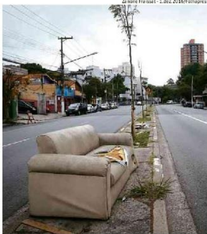
Sofá abandonado no canteiro central de via da zona oeste

Entre os serviços, também está programada a instalação