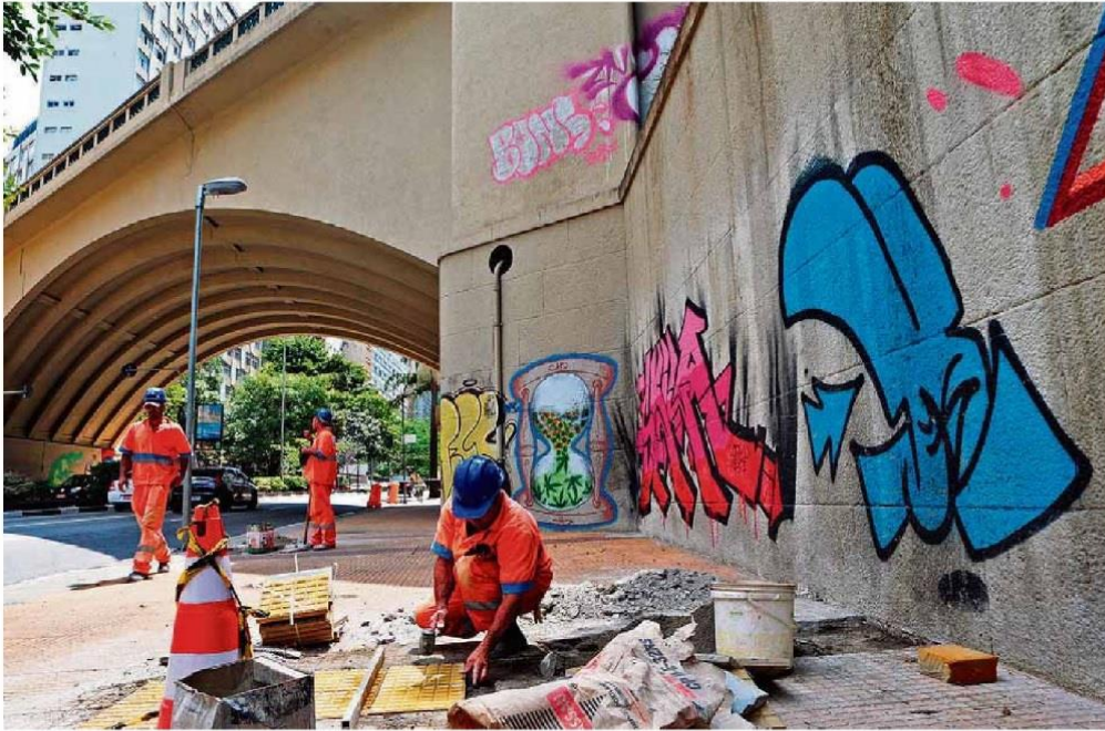
Alvo. Funcionários faziam manutenção ontem na calçada da Avenida 9 de Julho; uma ação de rotina, segundo a Prefeitura