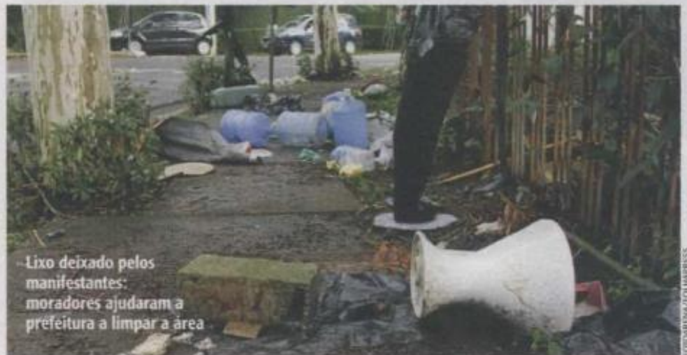
Lixo deixado pelos manifestantes: moradores ajudaram a prefeitura a limpar a área

problemas semelhantes. A rua do prédio onde mora o prefeito Fernando Haddad , no Paraíso, foi alvo recentemente de um protesto de trinta taxistas contra o Uber. Em 2013, jovens tomaram a via para reclamar do aumento do transporte público. "O que incomoda mais é o barulho", diz Lúgia Chedid, uma das moradoras do condomínio. Desde o ano passado, o prefeito vem reformando uma casa de 586 metros quadrados no Planalto Paulista, avaliada em 2 milhões de reais, e cogita se mudar para lá.