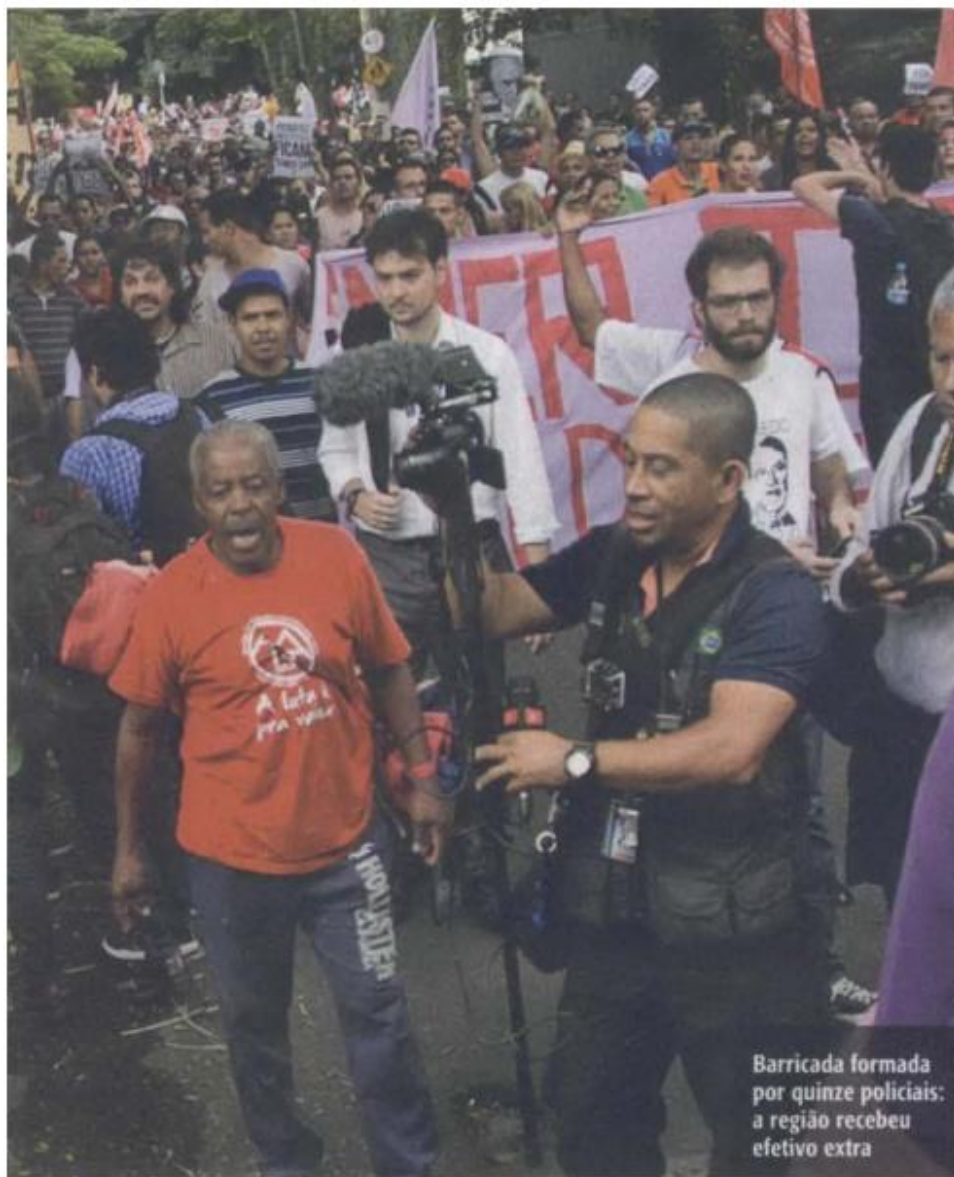
Barricada formada por quinze policiais: a região recebeu efetivo extra