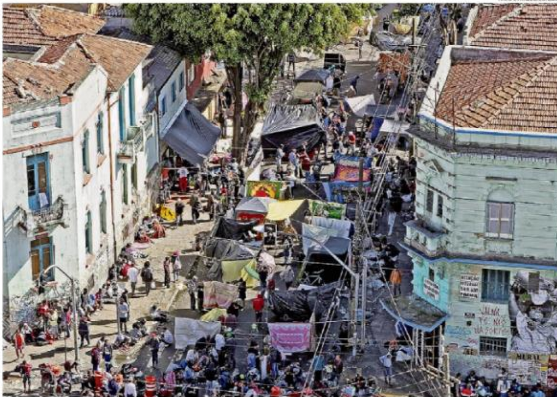
'Feira'. Estruturas com mesas e lonas ressurgem logo que GCM deixa a área; ainda não houve confrontos