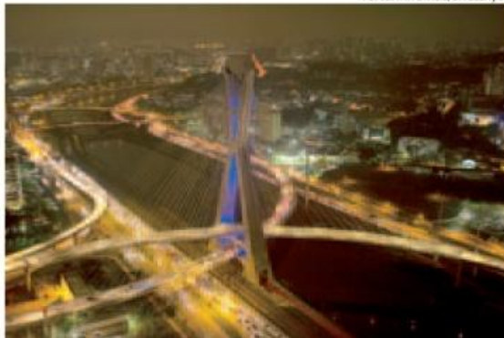
Ponte estaiada é um dos oito monumentos participantes do evento...