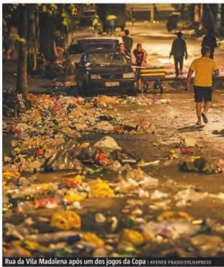
Rua da Vila Madalena após um dos jogos da Copa | AGENCIA PHADOU/IMPRESS

A reunião terá a participação de moradores, comerciantes, diretores de blocos, e do o secretário municipal de Cultura, Nabil Bonduki. © METRO