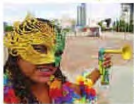
Folia já está no clima no local do baile

Festa em um dos pontos mais tradicionais da capital faz parte da folia de rua deste ano, que cresce em blocos – são 300 – e também em estrutura P27