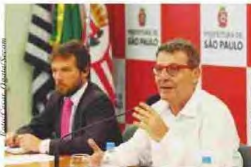
Lançamento do Plano de Apoio ao Carnaval de Rua de São Paulo e do Guia de Blocos

A organização do Carnaval de Rua paulistano se iniciou em 2013, com um processo de descriminalização dos blocos e facilitação das licenças para os desfiles. “Foi em três diretrizes: organização territorial com as subprefeituras, a criação de banco de dados compartilhado com todas as informações e autorização centralizada para os blocos, que antes tinham que pedir licenças a 15 órgãos”, disse o secretário municipal de Cultura em