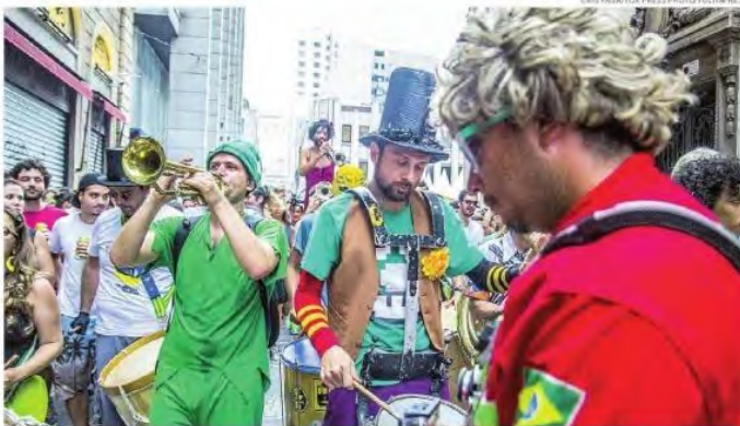
Bloco Orquestra Voadora em desfile ocorrido no último sábado (24) pelas ruas do centro velho de São Paulo

Foram cadastrados 300 blocos (50% a mais do que 2014). Mais da metade estará entre as regiões da Sé e Pinheiros (153). Serão 900 banheiros químicos para atender os cerca de 2 milhões de foliões.