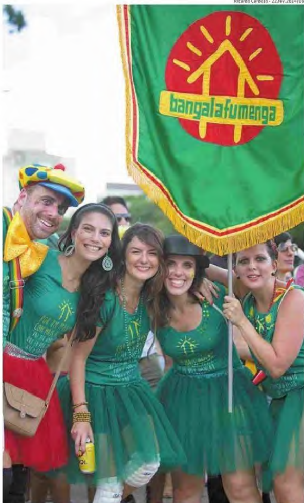
Folhões no bloco Bangalafumenga, na av. Sumaré, zona oeste, no Carnaval do ano passado