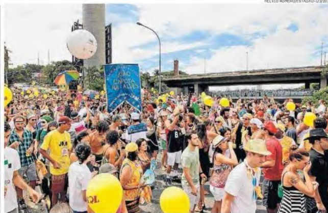
Capota na Alves em 2014. Fiscalização será mais rigorosa na Vila Madalena e imediações

Neste ano, serão 75% blocos de rua a mais do que em 2014, quando houve, ao todo, 174. A maior parte deles estará concentrada na região central, além de Vila Madalena e Pinheiros. Até