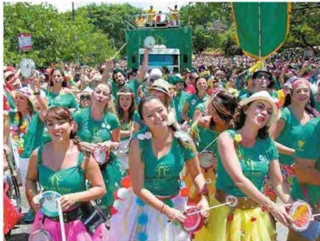
Foliões no bloco Bangalafumenga, na av. Sumaré, zona oeste, no Carnaval do ano passado