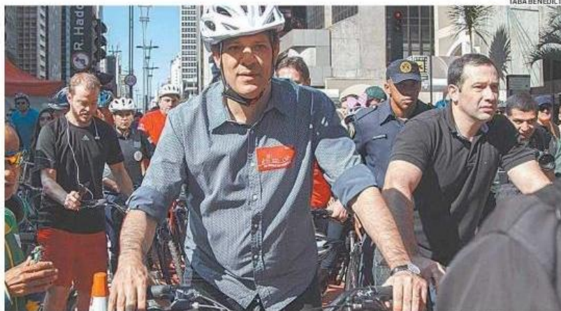
O prefeito Fernando Haddad anda de bicicleta na inauguração da ciclovia da Avenida Paulista, ontem

de Haddad chega a 334,9 km de faixas exclusivas para bicicletas. No entanto, nem todos pareciam satisfeitos. Em um trecho da via, houve um protesto com gritos e cartazes contra o PT.