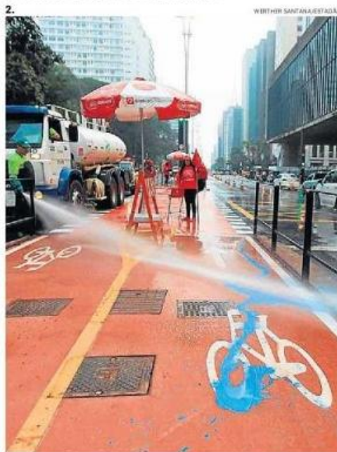
2. Prefeitura lava tinta azul despejada de madrugada