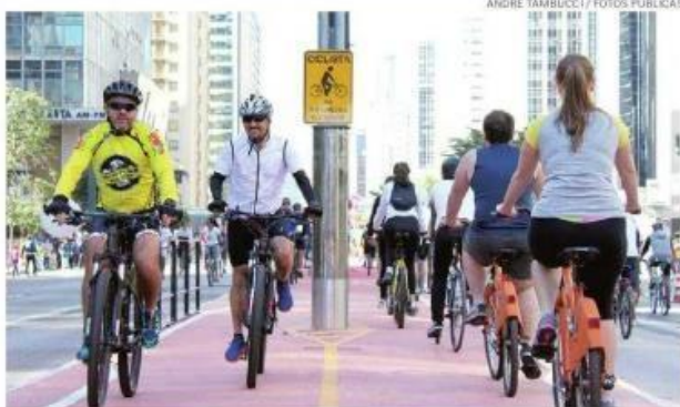
Avenida foi fechada durante o dia para que ciclistas estreassem a nova via