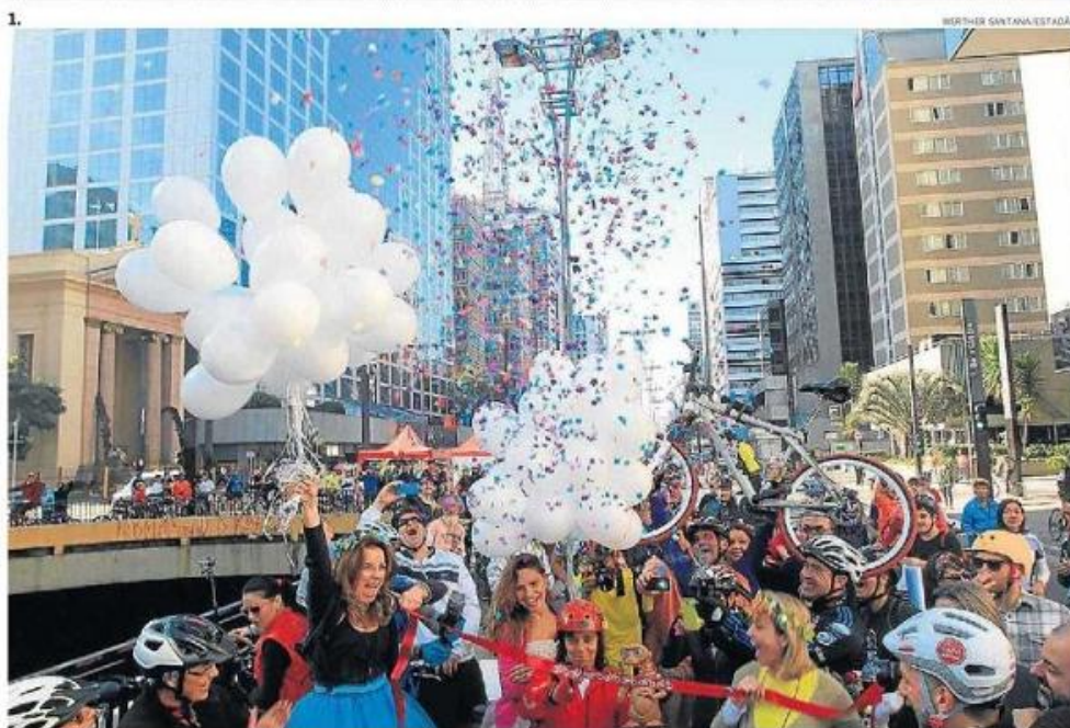
1. Ciclovistas soltam balões e lançam papel picado para comemorar a abertura da via exclusiva

Vídeo: Ciclistas ocupam Avenida Paulista estadao.com.br/e/ciclo