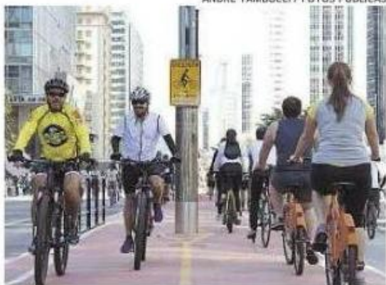
■ Ciclistas fizeram uso da via na Paulista desde as 9h