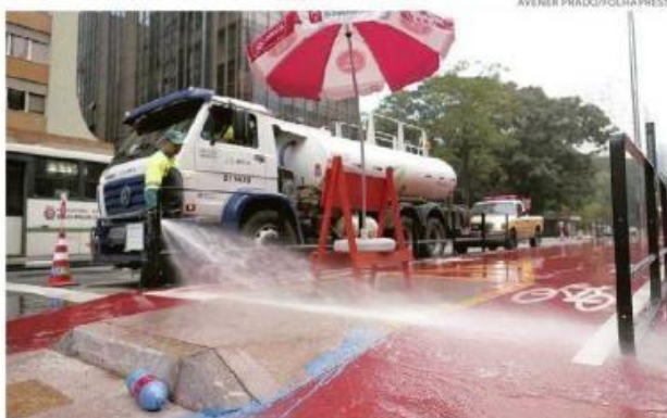
No início da manhã, prefeitura teve que limpar tinta azul jogada por vândalos