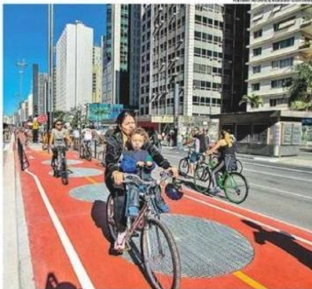
SUCESSO. No primeiro dia de funcionamento, via teve bom público

O prefeito Fernando Haddad (PT) exaltou o “símbolo de qualidade de vida” e disse que essa é uma política que “deveria ser abraçada por todos os partidos”. Diversos ciclistas que se dirigiram ao local carregavam balões brancos. O início do tráfego, no entanto, também ocorreu sob protestos. Durante a madrugada, tinta azul foi jogada em um trecho da via próximo ao prédio da Fiesp (Federação das Indústrias do Estado de São Paulo), mas foi retirada após limpeza da prefeitura. Outros movimentos estenderam faixa de “Fora PT”.