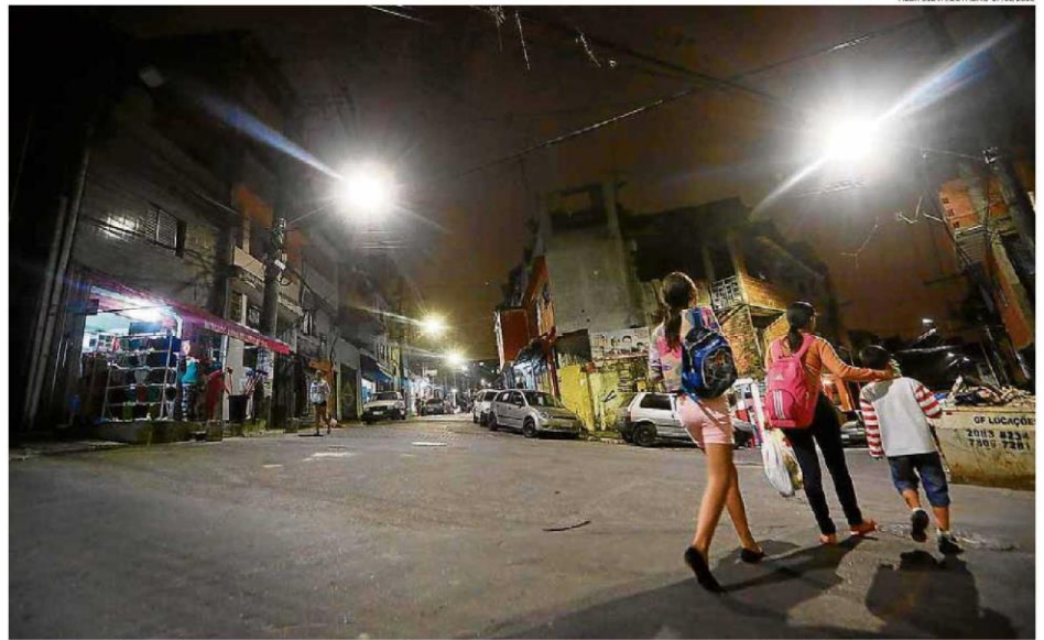
Gasto. Prefeitura antecipou parte da troca das lâmpadas e causou desconforto em investidores interessados na parceria

Há uma lei que determina que a Cosip deve ser usada exclusivamente para financiar a iluminação pública, mas os grupos privados dizem não confiar