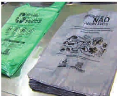
Sacola de plástico custa cerca de R$ 10 a unidade em supermercados

Segundo a Apas, antes da nova lei entrar em vigor, o consumo médio de sacolas plásticas era de 708 unidades anuais por habitante, resultando em 8,5 bilhões de sacolas por ano ou 23 milhões de sacolas por dia. Essa média caiu para 212.