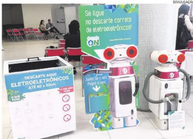
Mascote Descartes, montado com resíduos eletroeletrônicos

O projeto-piloto será executado na Subprefeitura da Lapa, com previsão para terminar no final de outubro de 2016, e contou com auxílio técnico da Japan International Cooperation Agency (Jica), órgão do governo japonês responsável por implementar ações socioeconômicas em países em desenvolvimento. "O bairro da Lapa foi escolhido devido a projetos de reciclagem que já acontecem na região. Os membros da Jica juntamente com os outros órgãos envolvidos viram uma possibilidade grande de aderência ao projeto pela população local", disse o presidente da Autoridade Municipal de Limpeza Urba-