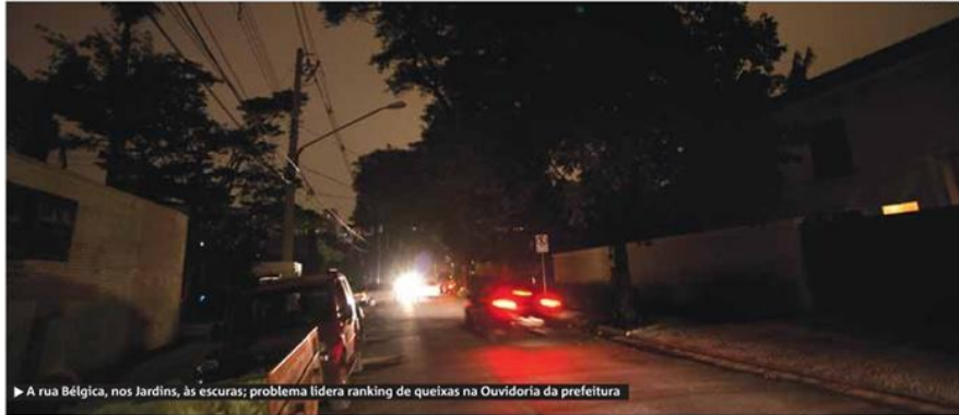
► A rua Bélgica, nos Jardins, às escuras; problema lidera ranking de queixas na Ouvidoria da prefeitura