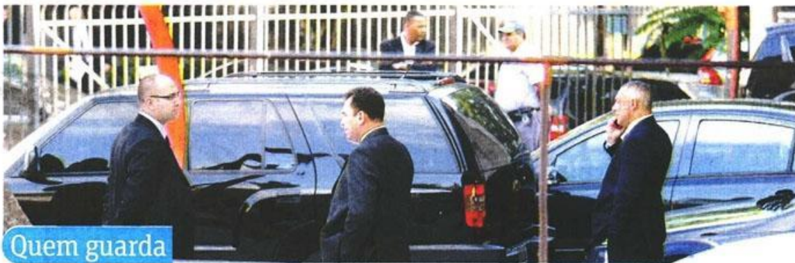
Seguranças particulares dos moradores aguardam fim da reunião do lado de fora do museu de esculturas