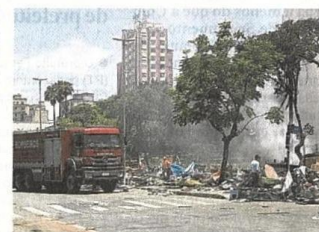
Fogo. Lixo, móveis e barracos queimaram

disseram que a acusada também é dependente de crack.