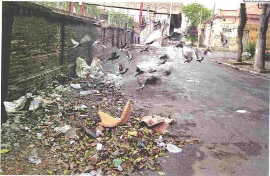
Pombos em restos de lixo ao lado de muro da CPTM na rua Luigi Greco, na Barra Funda, na região central, onde há vários pontos de descarte irregular de entulho; Santa Cecília e República têm o mesmo problema