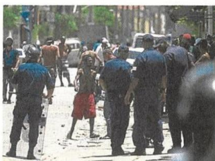
Migração. Grupo acabou sendo dispersado