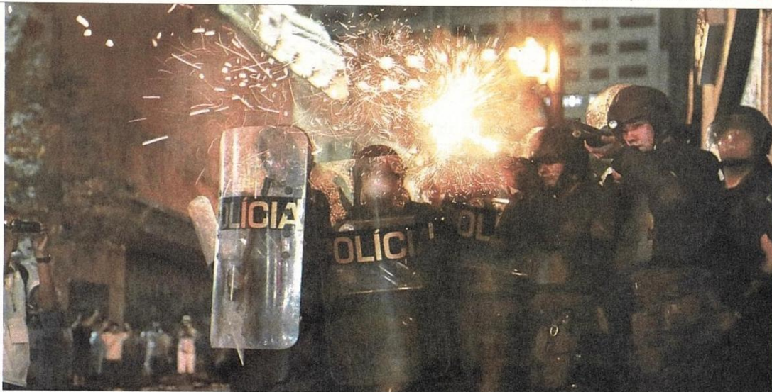
Policiais reagem a manifestantes durante protesto contra o aumento da tarifa de transporte; bancos foram depredados