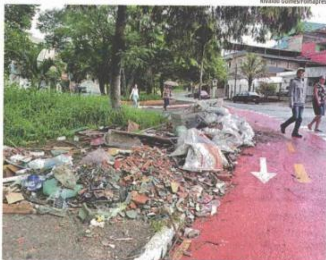
■ Lixo e entulho acumulados na praça João Pais Malio, na zona sul; local é frequentado por crianças