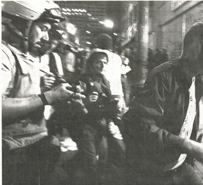
Homem com ferimento na cabeça deixa área de conflito entre manifestantes e PMs, ontem, durante protesto contra o aumento da tarifa, no centro da capital

O Movimento Passe Livre já marcou o próximo protesto para terça-feira, dia 27. A concentração será no largo da Batata, próximo à estação Faria Lima, na zona oeste da capital paulista. (FSP)