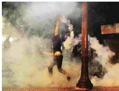
Black bloc pega bomba da PM e atira de volta nos policiais militares

Acessos a estações do Metrô foram fechados para evitar que os vândalos invadissem