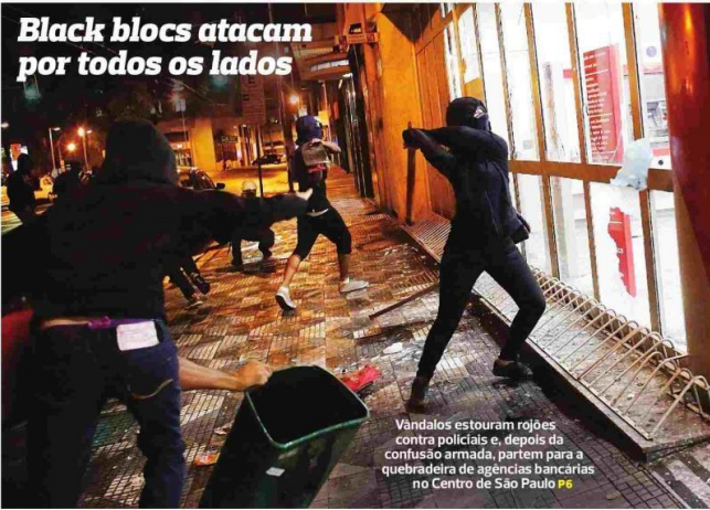
Vandales estouram rojões contra policiais e, depois da confusão armada, partem para a quebra de vidros de agência bancária no Centro de São Paulo P6

Mulher vestida de preto e com o rosto coberto destrói vidros de uma agência bancária durante manifestação contra o aumento da tarifa