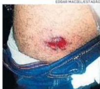
Ferimento. Repórter foi atingido na perna

justo ter o pessoal brigando pelos nossos direitos", disse.