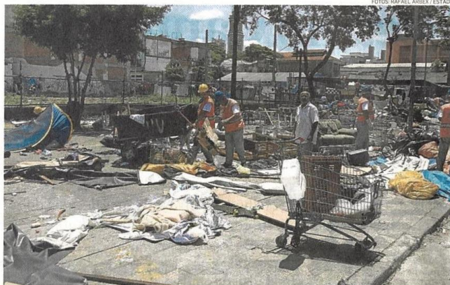
Remoção. Prefeitura aproveitou a confusão para limpar a área onde ficam os dependentes