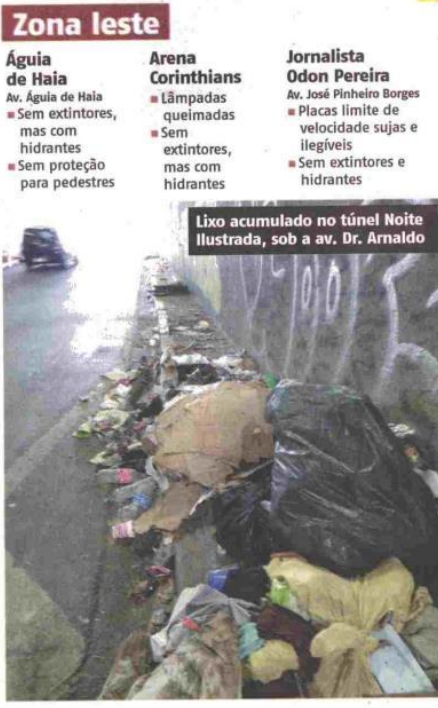
Lixo acumulado no túnel Noite Ilustrada, sob a av. Dr. Arnaldo