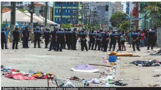
Agentes da GCM foram recebidos a pedradas e pauladas.

De acordo com a administração municipal, o De-