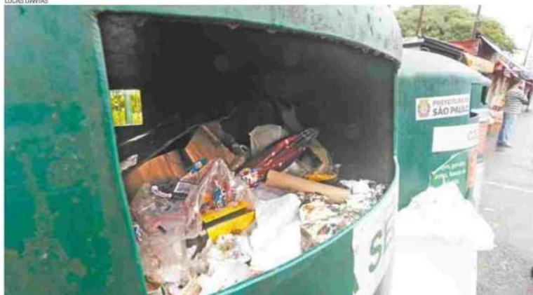
junto e misturado - Lixo orgânico e material não reciclável vão parar em PEV do Terminal Jabaquara