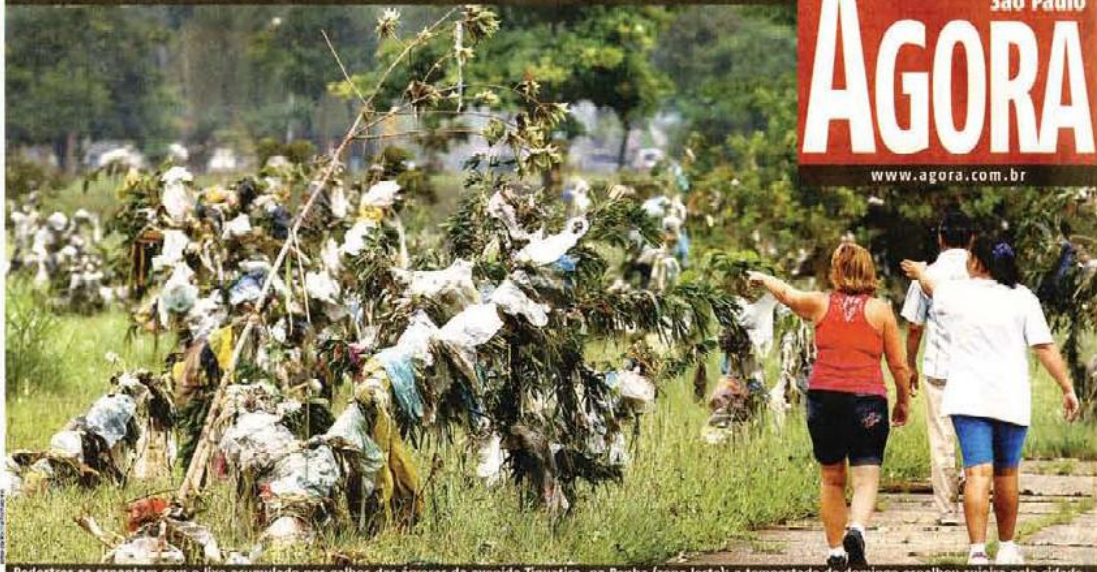
Pedestres se espantam com o lixo acumulado nos galhos das árvores da avenida Tiquatira, na Penha (zona leste): a tempestade de domingo espalhou sujeira pela cidade