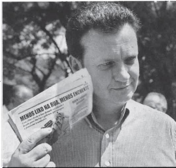
O prefeito Kassab distribuiu panfletos para zeladores

Já o morador que colocar seus resíduos na rua antes de duas horas do horário da coleta é multado em R$ 50. A multa por descarte de entulho em locais inapropriados chega a R$ 12 mil. (CV e FB)