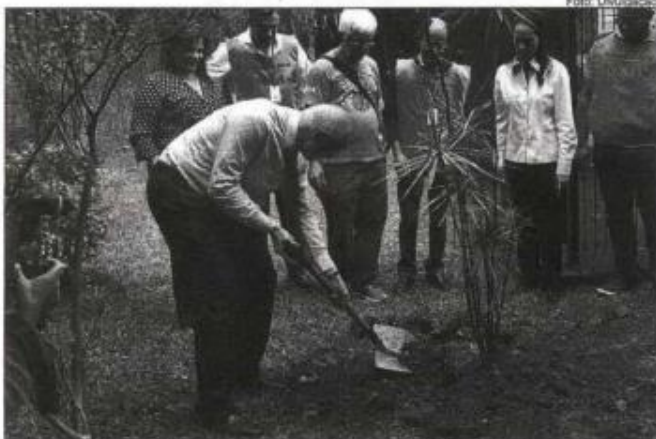
O secretário de Direitos Humanos, Eduardo Suplicy, planta uma árvore durante a abertura da segunda edição do programa

O plantio de uma árvore marcou a abertura da segunda edição do programa Prefeitura no Bairro, na Subprefeitura Pirituba/Jaraguá, na última segunda-feira, 9. A ação integrada entre todas as secretarias