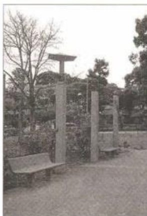
Espaço sem cobertura no