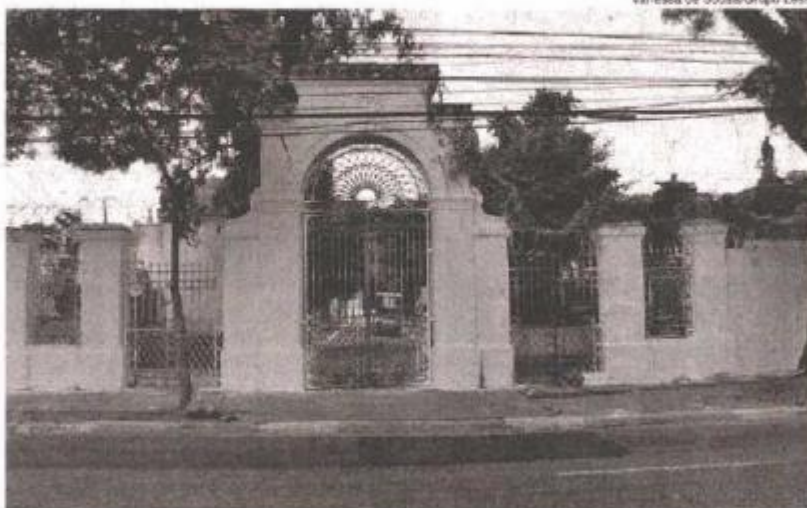
Vanessa de Sousa/Grupo Leste

Como acontece todos os anos, há esquema especial nos cemitérios para organizar as visitas no entorno dos cemitérios e também no transporte público, com o reforço das linhas que levam até os endereços. E, no caso do Quarta Parada, a reportagem questionou a pasta sobre o fechamento dos portões que dão acesso ao cemitério.