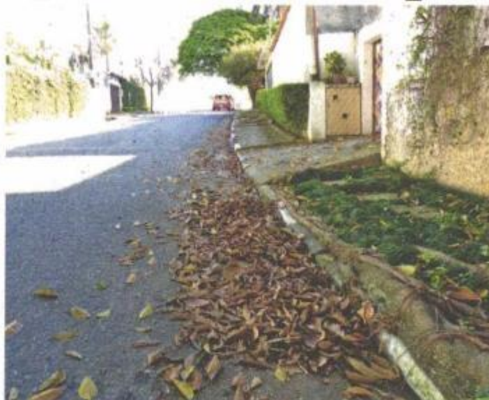
Falta de varrição na rua Amandaba está sendo alvo de reclamações