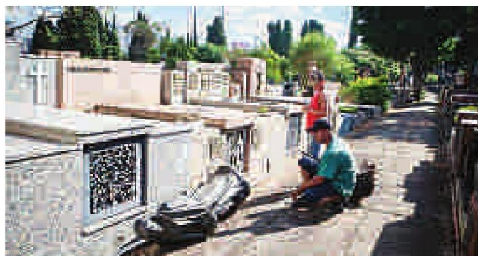
Jardineiro olha estátua derrubada, que não foi levada por causa do peso

investigadores é que o grupo que fugiu para a Cracolândia era de moradores de rua, pagos para realizar o furto.