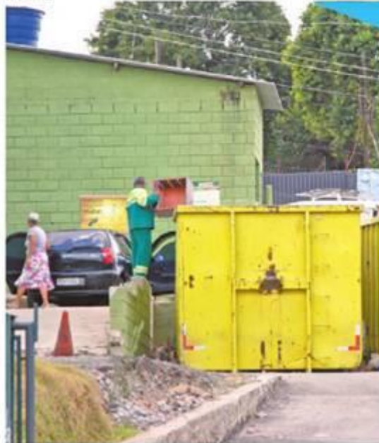
Descarte - Moradora deixou restos de móveis no Ecoponto Nova York