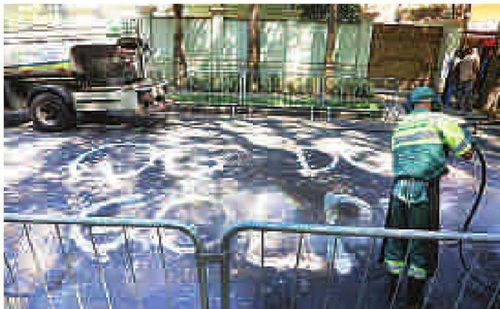
Funcionários de empresa contratada pela Prefeitura limpa o chão

Duas horas depois, um caminhão de limpeza de uma empresa que presta serviço para a Prefeitura de São Paulo chegou ao local para lavar a rua e apagar a frase que havia sido pintada no asfalto. Após o protesto, Temer decidiu, por orientação da segurança da Presidência, embarcar para Brasília. Ele deixou São Paulo rumo à capital federal em um avião da Força Aérea Brasileira por volta das 16h30. A previsão inicial era de que Temer passasse o feriado e o fim de semana na capital paulista fazendo reuniões.