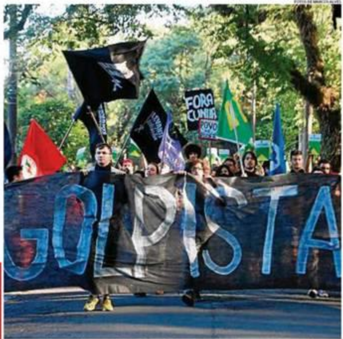
Protesto realizado pelo Levante Popular da Juventude em frente à casa do vice presidente

Dois horas após a manifestação, uma empresa de limpeza que presta serviços para Prefeitura de São Paulo apagou a pichação com jatos d'água. Dois caminhões da Inova realizaram a lavagem em meia hora com pelo menos 12 funcionários. ✕