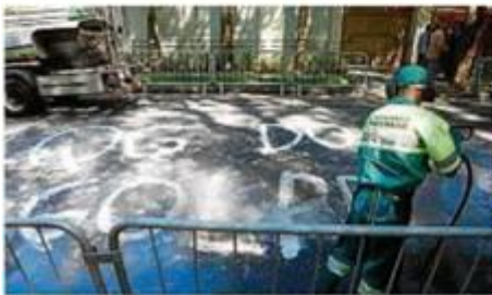
Empresa ligada à prefeitura apaga protesto contra Temer