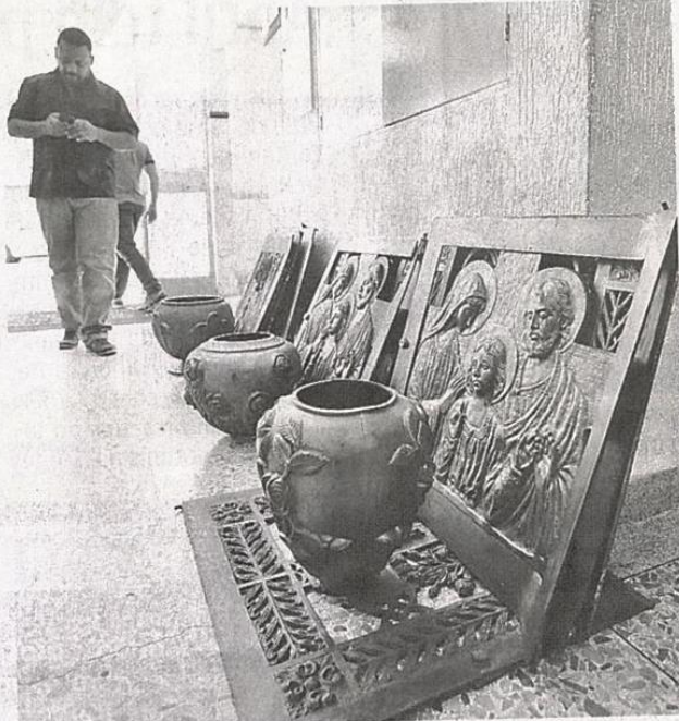
■ Portões de túmulos e vasos em bronze que foram furtados do Cemitério São Paulo, em Pinheiros