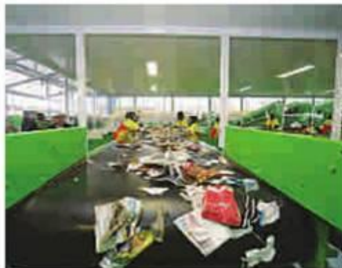
Central de Santo Amaro processa 125 toneladas de lixo diariamente