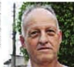
BOM PARA TODOS

"Ter a coleta vai trazer benefícios. A gente vai separar o lixo direito e gerar emprego"