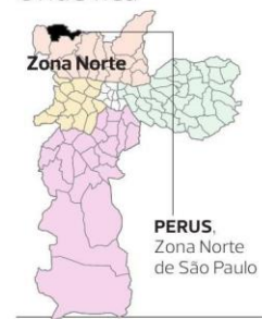
PERUS, Zona Norte de São Paulo