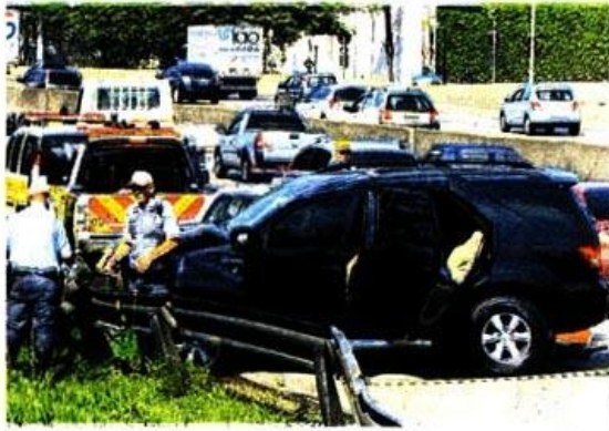
Toyota Hilux do bancário ficou com a frente totalmente destruída