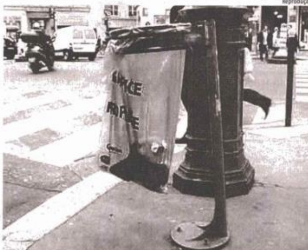
■ Lixeira em rua de Paris, onde elas não são presas a postes; prefeitura diz que seguiu esse modelo

Para ele, os sacos de 60 litros que acompanham os modelos experimentais podem suprir a demanda. "Mas depende muito do sistema de retirada. Além disso, é preciso conscientizar e educar a população para usar as lixeiras", diz. Ele afirma ainda que a prefeitura precisa pensar uma maneira de fazer coleta seletiva para diminuir uso de aterros sanitários. (AS)