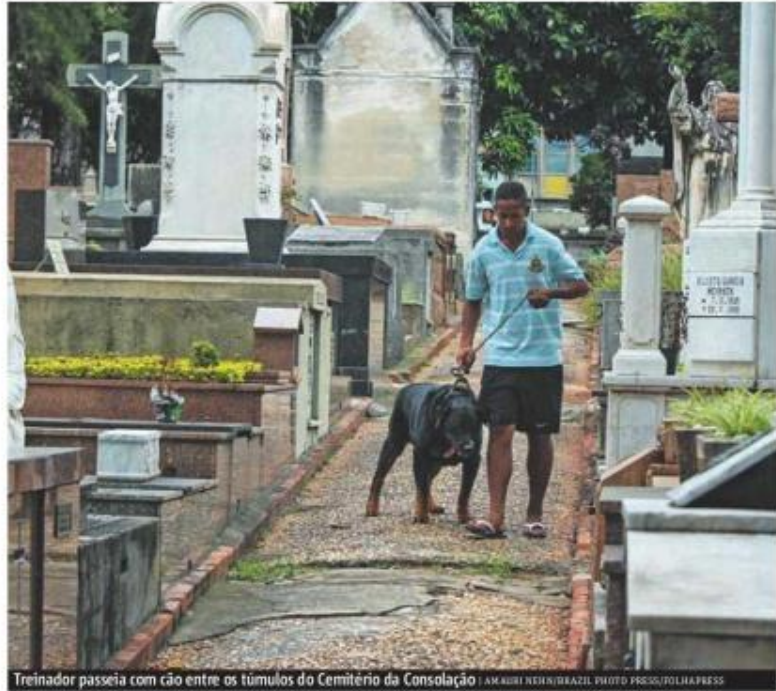
Treinador passeia com cão entre os túmulos do Cemitério da Consolação

Segundo a autarquia, para levar o projeto aos outros cemitérios ainda será necessário fazer uma licitação para contratar a empresa que prestará o serviço. ● METRO