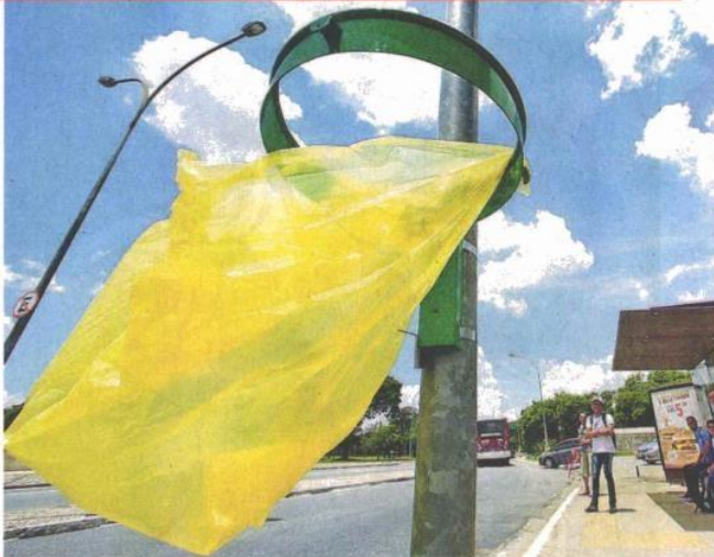
■ Parte do saco plástico desprende-se do aro de metal no novo modelo de lixeira que a prefeitura testa em rua perto do parque Ibirapuera (zona sul); ideia é reduzir gastos

A prefeitura instalou na região central e nas zonas sul e leste 171 lixeiras de um novo modelo que é só um aro de metal e um saco reciclável com furos para que não acumule água. Segundo a prefeitura, o modelo é usado em cidades como Paris e Barcelona, e o objetivo é reduzir o vandalismo. Após três meses de teste, a gestão diz que fará uma pesquisa com a população para avaliar as novas lixeiras. Especialista diz que o modelo apresentado pode facilitar que o lixo se espalhe.