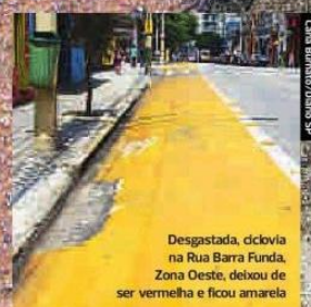
Desgastada, ciclovia na Rua Barra Funda, Zona Oeste, deixou de ser vermelha e ficou amarela