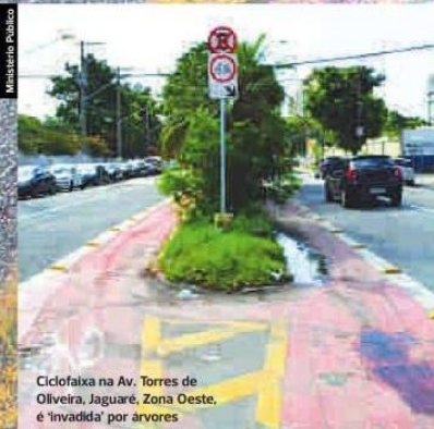
Ciclofaixa na Av. Torres de Oliveira, Jaguaré, Zona Oeste, é 'invadida' por árvores

"Não nos interessa esse antagonismo entre os ciclistas e a Promotoria. Estamos nos colocando à disposição para mediar este conflito, inclusive levando ao Judiciário todos os estudos técnicos que demonstram não só a viabilidade, mas a necessidade de proteger os ciclistas da cidade", disse.