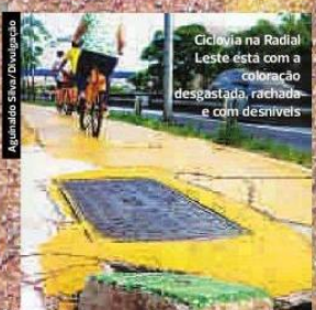
Ciclovia na Radial Leste está com a coloração desgastada, rachada e com desníveis