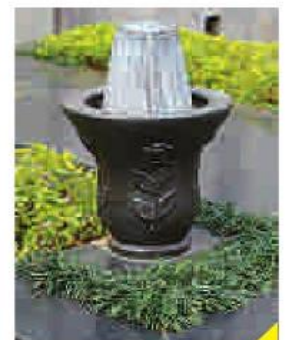
NÃO SOBROU NENHUM Quatro vasos de 20 quilos e 65 centímetros de altura cada um (foto acima) foram furtados em março de um túmulo no Cemitério Consolação, no Centro