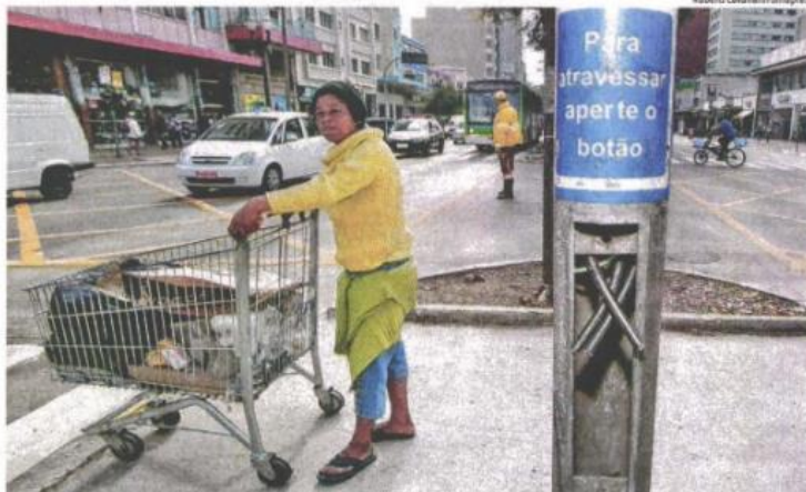
■ Semáforo quebrado após furto de fios na esquina da avenida Rio Branco com a rua dos Gusmões, na Santa Ifigênia (centro); farol é alvo constante de crimes