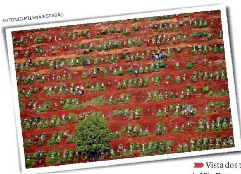
➔ Vista dos túmulos de Vila Formosa