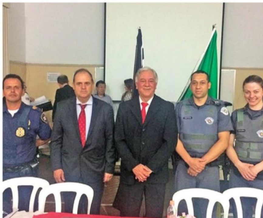
Ipiranguistas compareceram a reunião do Conseg Ipiranga

“A tarefa ali é simples”, avalia o reclamante. “Basta dar uma pequena limpada no terreno, fazer uma pista de skate para que os marmanjos deixem de arrebentar a escadaria do Monumento à Independência e iluminar a área”, explica. “O parque está abandonado, alguns usuários