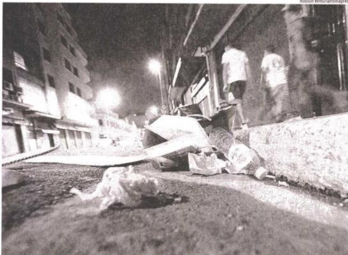
■ Sujeira em sarjeta da rua 25 de Março, no centro de São Paulo; os 15 mil garis que atuam na limpeza da capital decidiram entrar em estado de greve ontem