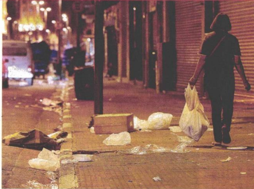
■ Sujeira nas ruas da capital, como a da 25 de Março (região central), pode aumentar caso os garis entrem em greve na próxima semana; segundo sindicato, prefeitura planeja reduzir verba da limpeza

Garis da capital ameaçam entrar em greve pois, segundo o sindicato, as empresas que atuam no setor planejam a demissão de mais de 2.000 trabalhadores. Os cortes ocorreriam porque a prefeitura teria decidido reduzir em 10% a verba para limpeza. As empresas não comentaram. A prefeitura diz que não há informações sobre redução na verba e que, agora, negocia reajuste salarial. AS