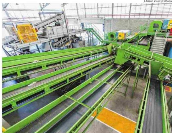
Central de processamento de lixo de Santo Amaro (zona sul), que opera com ociosidade