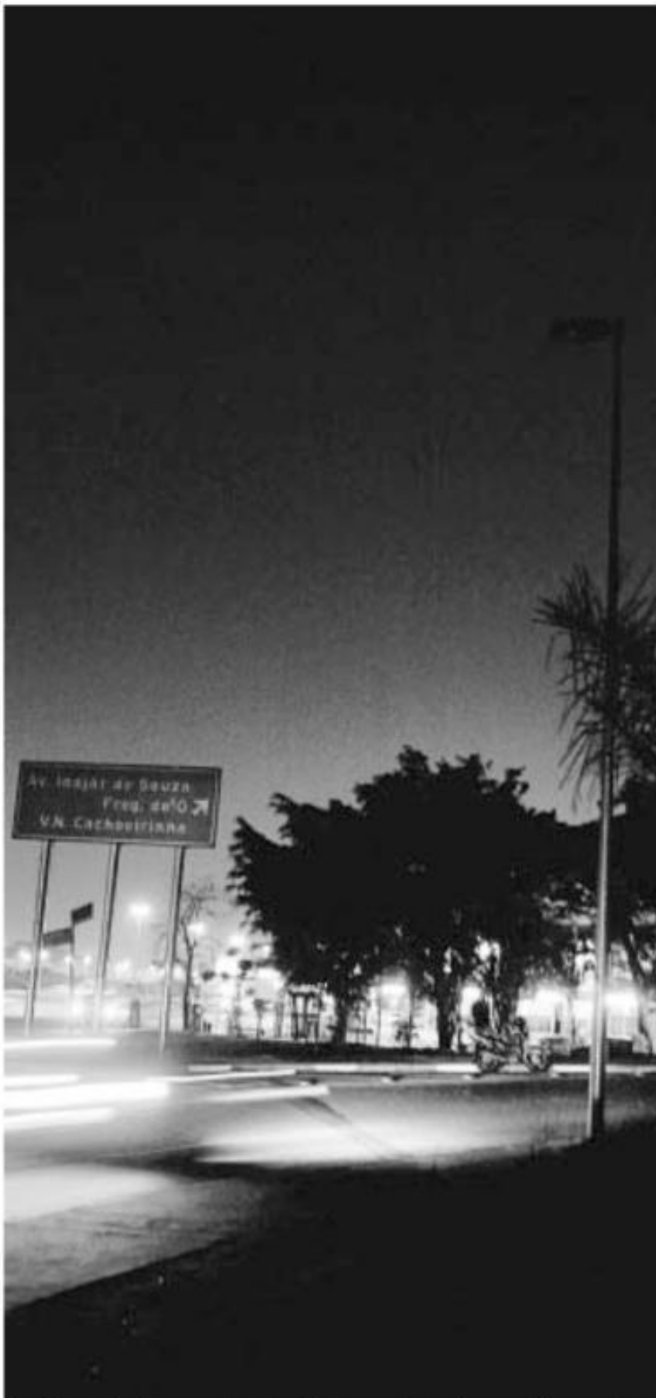
Trecho perto do acesso à Ponte da Freguesia do Ó que está apagado