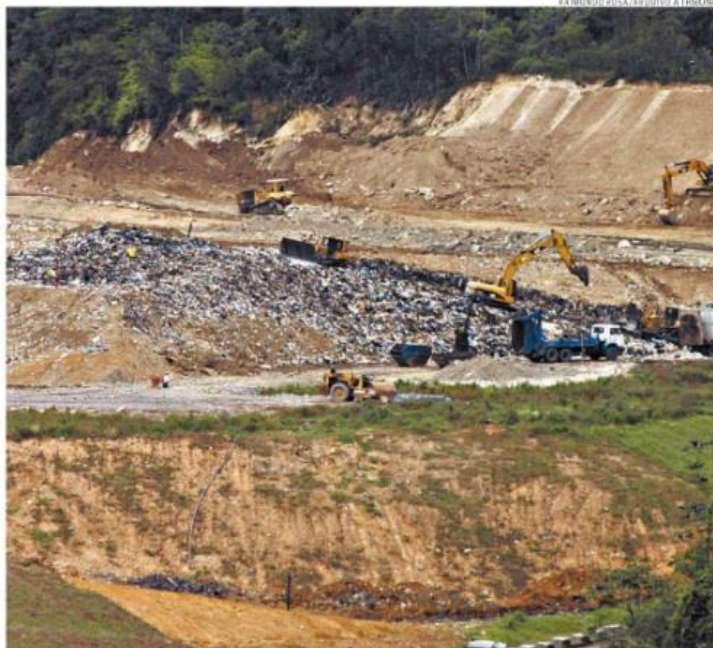
O Aterro Sanitário do Sítio das Neves, na Área Continental de Santos, é utilizado por sete cidades da região

"Estamos entre a cruz e a espada", diz a promotora do Gaema sobre a possibilidade de o Ministério Público do Meio Ambiente concordar ou não com essa ideia.