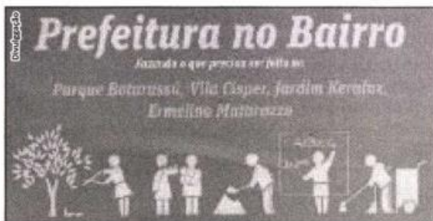
Programação visa aproximar estado e cidadão, oferecendo diversos serviços e atendimentos

A ação integrada da administração pública municipal “Prefeitura no bairro” chega ao bairro de Ermelino Matarazzo e será realizada entre os dias 10 a 15 de agosto. O atendimento é destinado a todos os moradores de Ermelino, Ponte Rasa e região. O local escolhido para essa ação foi a Praça Benedito Ramos Rodrigues no centro do bairro, nessa oportunidade, ocorrerão serviços de atendimentos direcionados a população local, tais como: CET no seu bairro; Melhorias na iluminação pública ; Mutirão de limpeza e cata bagulho; Manutenção e revitalização de ruas, calçadas e praças; Programação cultural;