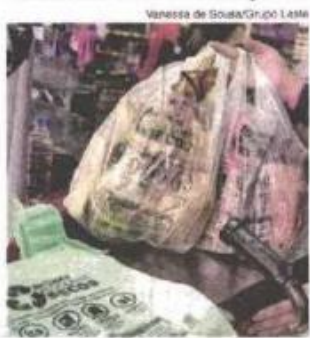
Vanessa de Sousa/Gr.00 Leste

informação e conscientização do consumidor". Página 5