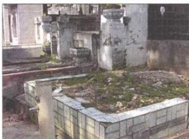
Campas destruídas pela natureza e atos de vandalismo