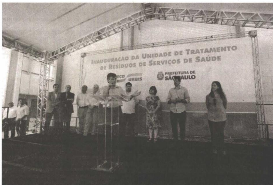
Inauguração da Unidade de Tratamento de Resíduos de Serviços de Saúde (UTRSS)

Durante a inauguração da UTRSS, Haddad informou que já encaminhou Projeto de Lei para a