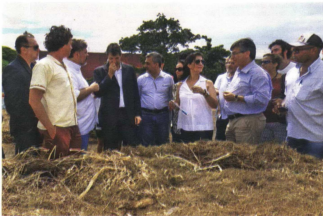
Prefeito visita pátio piloto na Lapa de Baixo que recebe resíduos orgânicos de feiras livres da região

Sustentáveis instalada na area da Subprefeitura Lapa e elogiou a iniciativa > Página 3