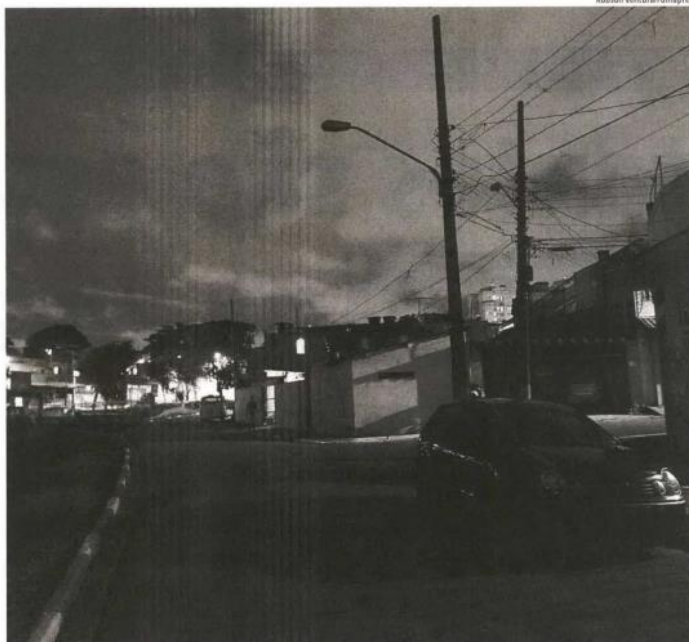
■ Escuridão na avenida Doutor Otávio Ramos, em São Miguel Paulista (zona leste); moradores dizem que abaixo-assinado entregue na prefeitura não adiantou nada

Envie sua queixa sobre serviços públicos para o WhatsApp do Agora (11) 97549-7959