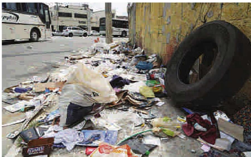
Na Rua João Teodoro, Centro, pneu velho acumula água, no ambiente perfeito para proliferação do Aedes aegypti

Multas para quem joga lixo nas calçadas e vias diminuíram 42% de 2014 para 2015. Enquanto isso, vítimas do Aedes aegypti aumentaram 300% em um ano