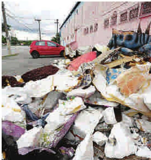
Alegorias jogadas na calçada em frente a escola de samba Rosas de Ouro