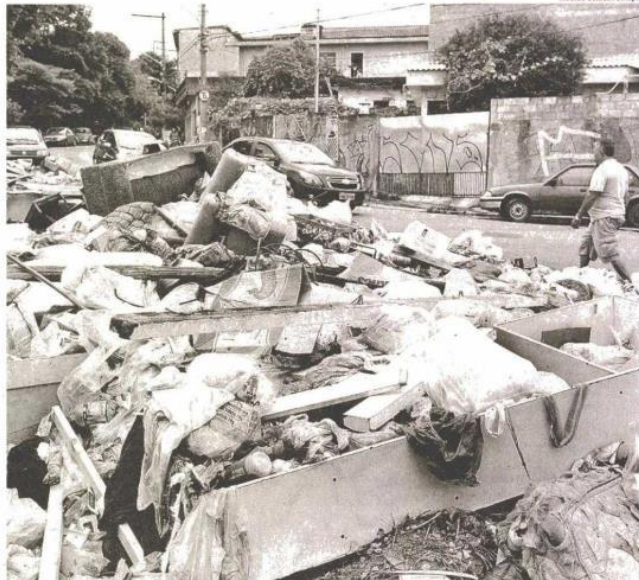
Montanha de lixo e entulho na rua Domingos Nogueira, ao lado do parque Raposo Tavares (zona oeste); moradores falam que mau cheiro é insuportável