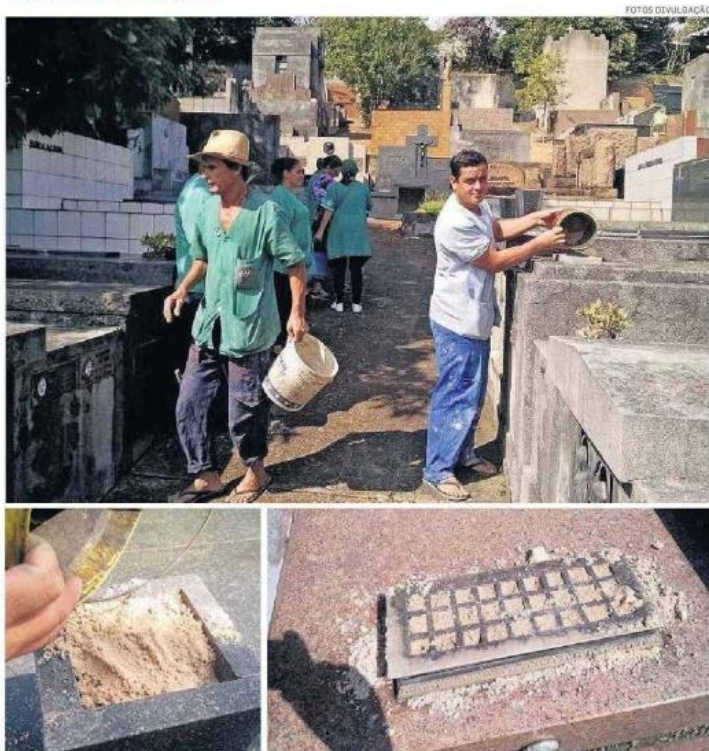
Pratos esvaziados e areia nos buracos. Ações passam a ocorrer a cada 2 ou 3 dias