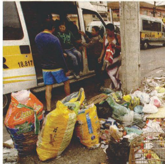
Entulho invade calçada na Cidade Ademar (zona sul)

Resto de obra em lugar errado, em última análise, provoca enchente no verão. No inverno, por exemplo, ele gera risco à saúde, por causa da poeira, uma das principais fontes de poluição do ar.