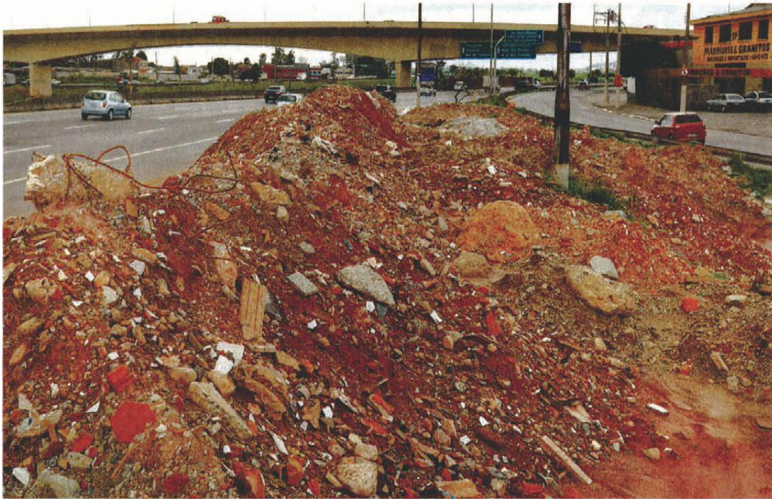
Material de construção e terra deixados em ponto próximo do viaduto Imigrante Nordestino, na zona leste da capital