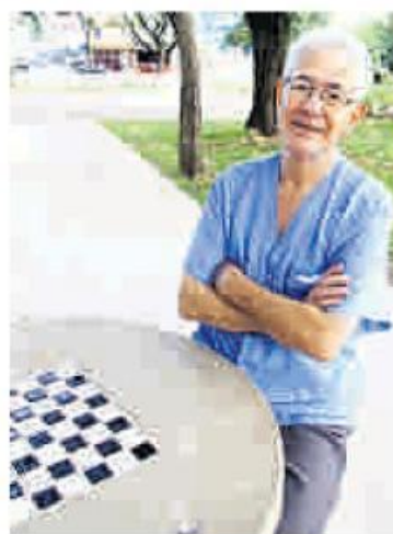
Santo reclama da bagunça à noite