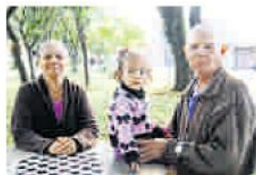
Casal diz que faltam mais policiamento