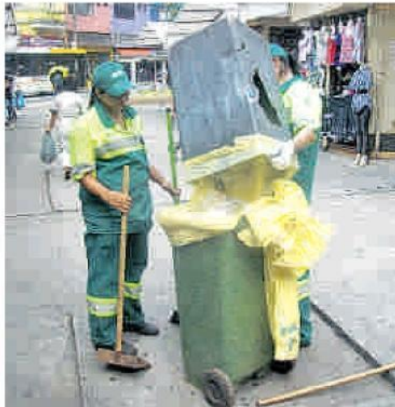
Os 16,2 mil garis varrem diariamente 249 toneladas de lixo

Além dos 1.160 caminhões para coletar resíduos, a capital