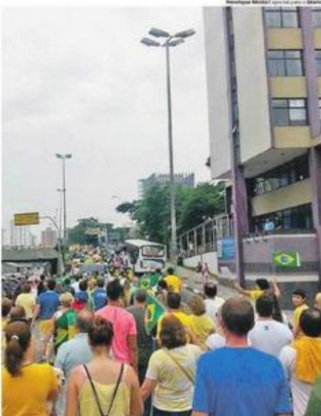
SANTO ANDRÉ. Manifestantes invadem a via expressa da Perimetral

São Bernardo registrou manifestação na Avenida Kennedy, em frente ao Ginásio Poliesportivo Adib Moysés Dib, com público em torno de 4.000.