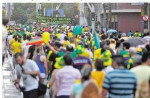
SÃO CAETANO. Volta do regime militar foi defendida por alguns manifestantes