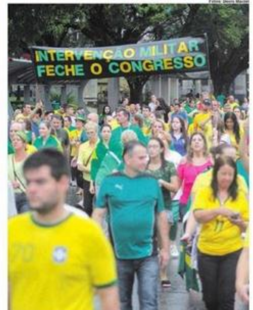
SÃO CAETANO. Na Avenida Goiás, pedido de intervenção militar