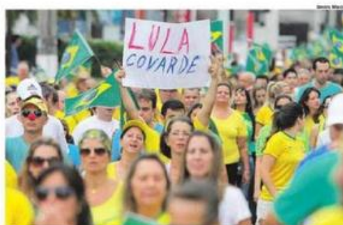
SÃO BERNARDO. Sumiço do ex-presidente foi questionado durante protestos