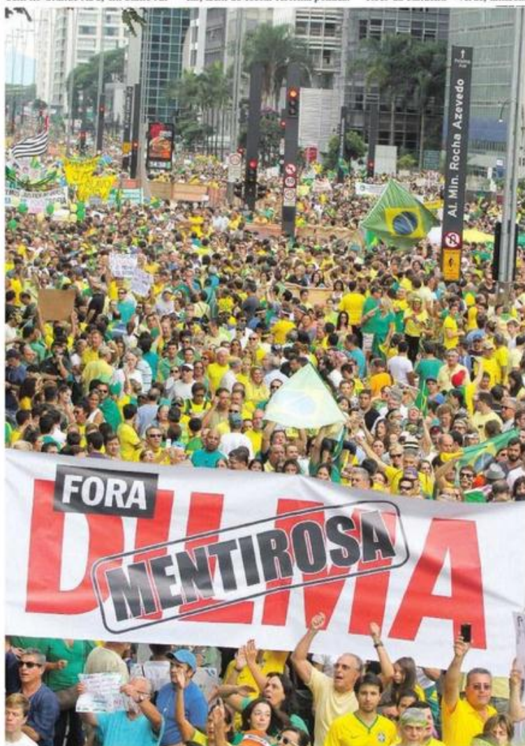
SINAL VERMELHO. Manifestantes tomaram a Avenida Paulista para defender, entre outras bandeiras, impedimento da presidente

(Secretaria-Geral) concederam entrevista coletiva, reconheceram a legitimidade dos descontentes e disseram que o Planalto vai propor alteração das regras eleitorais e leis mais duras para evitar desmandos. Político.5