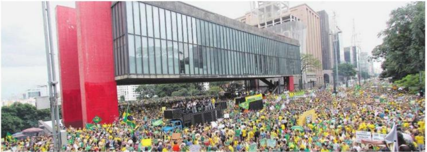
CONCENTRAÇÃO. A Avenida Paulista, no Centro da Capital, foi palco dos protestos, ocorridos ontem, contra a presidente Dilma Rousseff e o PT; ato ficou lotado e perdurou por aproximadamente cinco horas