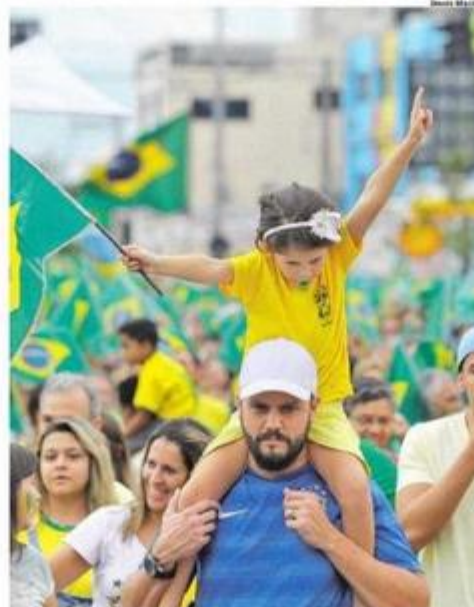
SÃO BERNARDO. Avenida Kennedy vira palco de ato contra Dilma