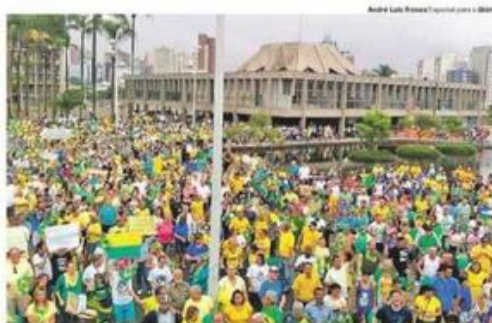
SANTO ANDRÉ. Verde, amarela, azul e branca foram as cores predominantes