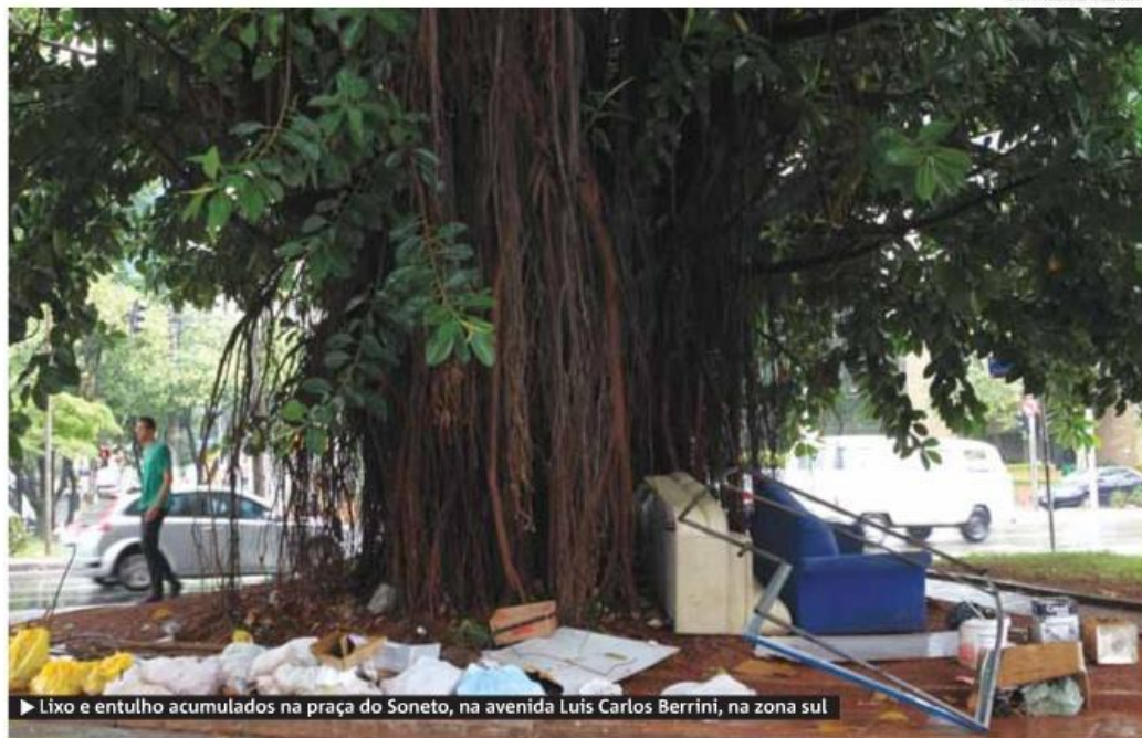
► Lixo e entulho acumulados na praça do Soneto, na avenida Luís Carlos Berrini, na zona sul