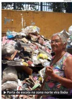
► Porta de escola na zona norte vira lixão

Já a Soma, que cuida da área de 18 subprefeituras, afirma que está empenhando esforços para resolver os problemas dentro dos prazos contratuais. ● M.S