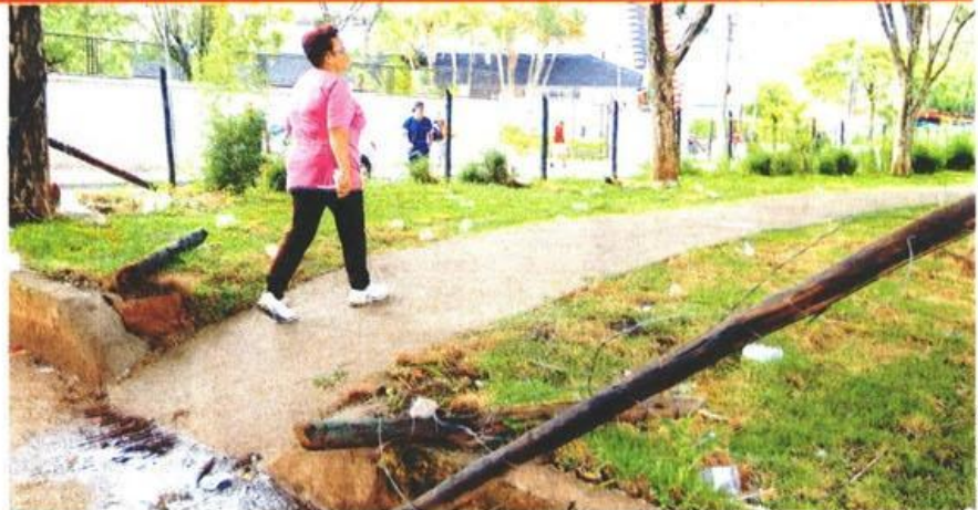
■ Pista para caminhada na avenida Nagib Farah Maluf, na zona leste, tem problemas como cerca quebrada e lixo; apenas 2 dos 14 locais visitados pelo Vigilante Agora ofereciam boas condições

Quem se exercita nas pistas de caminhada espalhadas pela capital tem de enfrentar buracos, trechos estreitos e até postes e árvores no meio do caminho. As piores pistas estão na zona leste. A prefeitura diz que faz serviços de zeladoria e promete intensificar a fiscalização das empresas responsáveis.