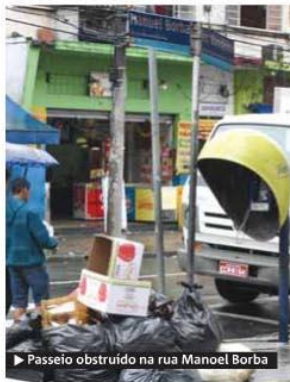
► Passeio obstruído na rua Manoel Borba