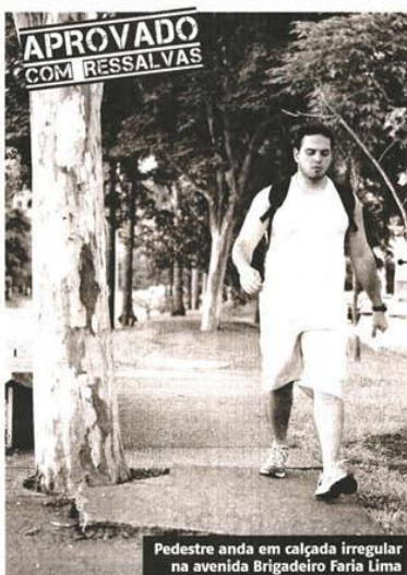
Pedestre anda em calçada irregular na avenida Brigadeiro Faria Lima