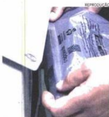
Embalagens são cobradas por meio de código de barras nelas impressos

A Abief (Associação Brasileira da Indústria de Embalagens Plásticas Flexíveis) também havia se posicionado contra a cobrança.