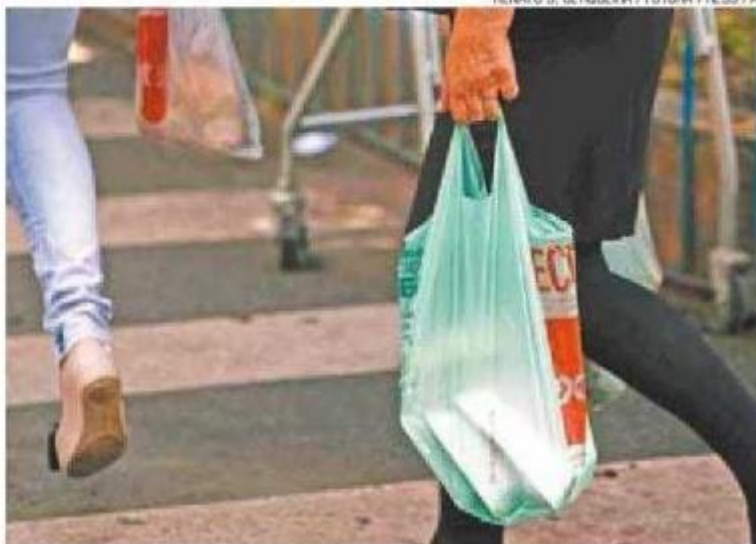
Reciclável - Procon diz que mercados não podem cobrar pela sacola