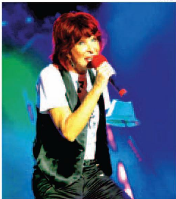
Rita Lee abre a festa amanhã, às 18h, no palco Júlio Prestes