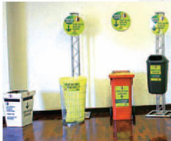
Prefeitura vai instalar 4,9 mil lixeiras para a Virada Cultural