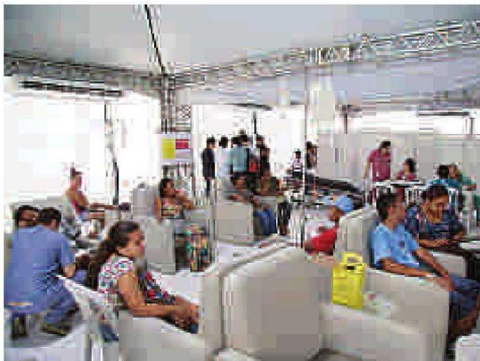
No ano passado, apenas as 10 tendas ofereceram os testes rápidos

de 300 metros em volta da casa da pessoa contaminada com dengue para que os agentes comunitários da Saúde e técnicos da Zoonose façam uma varredura nas casas do entorno para eliminar as larvas do Aedes aegypti . Nesse trabalho, a Prefeitura também poderá aplicar a lei de entrada à força, quando o morador se recusar a abrir a porta.