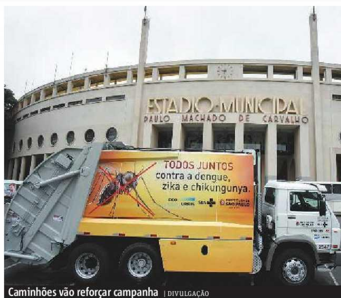
Caminhões vão reforçar campanha

O combate ao Aedes aegypti deverá ser mais forte neste ano devido à epidemia do vírus zika. Segundo o Ministério da Saúde, o vírus está ligado à alta de casos de microcefalia em recém-nascidos. METRO