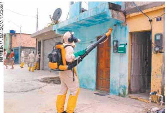
Cuidado - Funcionário da Prefeitura combate focos do aedes aegypti

Padilha destacou também que a Prefeitura utilizará drones para fazer o monitoramento de focos do mosquito e a lei que permite a entrada à força nos domicílios, sancionada pelo prefeito Fernando Haddad (PT).