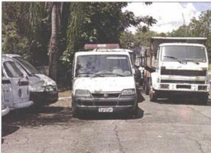
Carros e caminhões devem ser removidos até maio

Por causa da resposta, a reportagem voltou a questionar o Serviço Funerário sobre a água parada nos veículos, ressaltando que 40 dias é tempo suficiente para a proliferação de