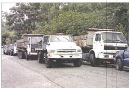
Mais de 60 veículos estão nos fundos do espaço

ar o alcance de informações sobre prevenção, combate e sintomas da Dengue, a Secretaria também firmou parcerias com instituições públicas e privadas, que auxiliarão na distribuição de mais de 15 milhões de materiais informativos, em diversos formatos. A operadora de telefonia móvel Claro vai disparar 10 milhões de torpedos com alertas sobre a Dengue.