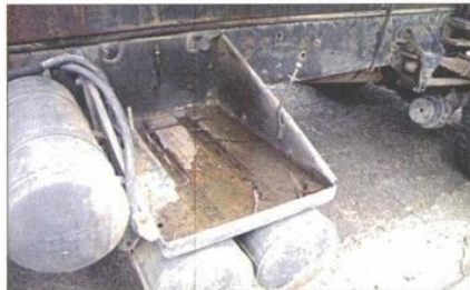
Caçambas dos caminhões e interior dos automóveis acumulam água das chuvas, terra e muita sujeira