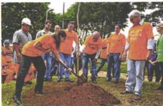
Primeiro bairro a ser beneficiado no Ipiranga é a Vila Brasilina

A região também receberá ações de desratização, melhorias na iluminação pública , limpeza de pontos de descarte irregular de entulhos e insta-