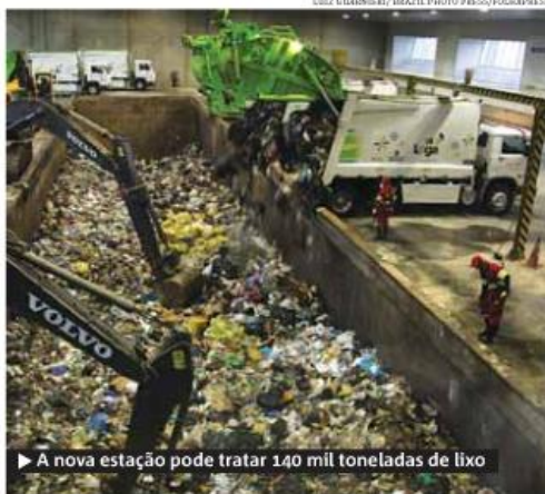
► A nova estação pode tratar 140 mil toneladas de lixo