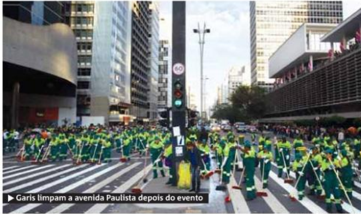
► Garis limpam a avenida Paulista depois do evento