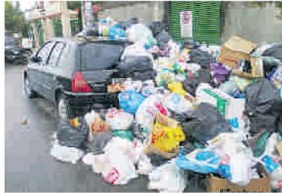
Carro coberto de lixo estacionado na Rua General Porfírio da Paz

De acordo com a nota, os veículos coletores que atende Sapopemba são equipados com GPS e o percurso e a velocidade ficaram registrados no sistema da empresa.