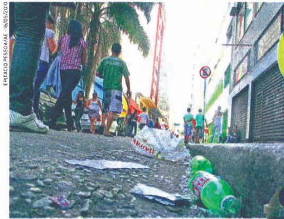
Os quatro milhões de frequentadores do evento em 2010 produziram 48 toneladas de detritos, segundo a Prefeitura