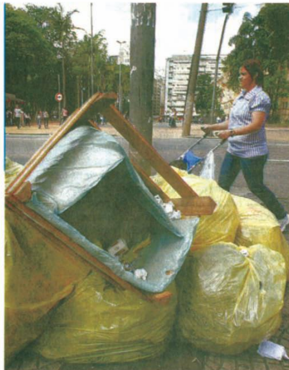
Lixo acumulado na região da praça da República, centro

Sobre a Virada, Kassab fez um apelo para que os paulis-