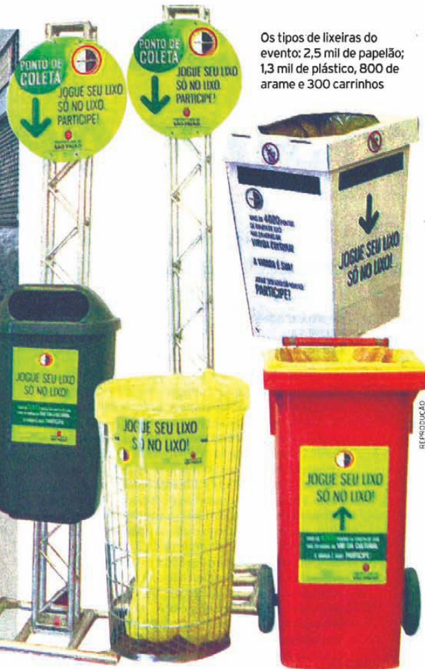
Os tipos de lixeiras do evento: 2,5 mil de papelão; 1,3 mil de plástico, 800 de arame e 300 carrinhos