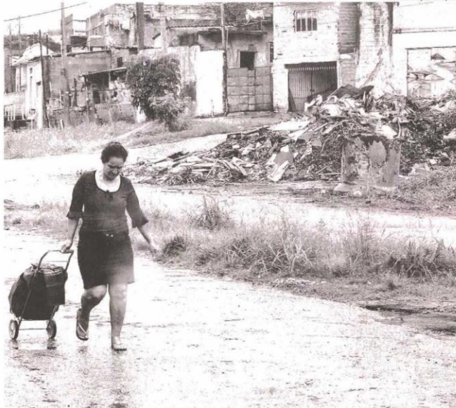
■ Moradora passa ao lado de entulho em rua do Lajeado (zona leste da capital), bairro que registrou o maior número de casos da doença por 100 mil habitantes

A secretaria também disse que um mutirão de cata-bagulho foi realizado no Lajeado no fim de janeiro. O próximo já está agendado. A pasta não falou sobre o projeto de instalação do ecoponto na rua Mangue Vermelho, citado por moradores. (M2)