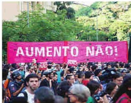
Antes da infiltração criminosa, manifestação seguia de forma pacífica