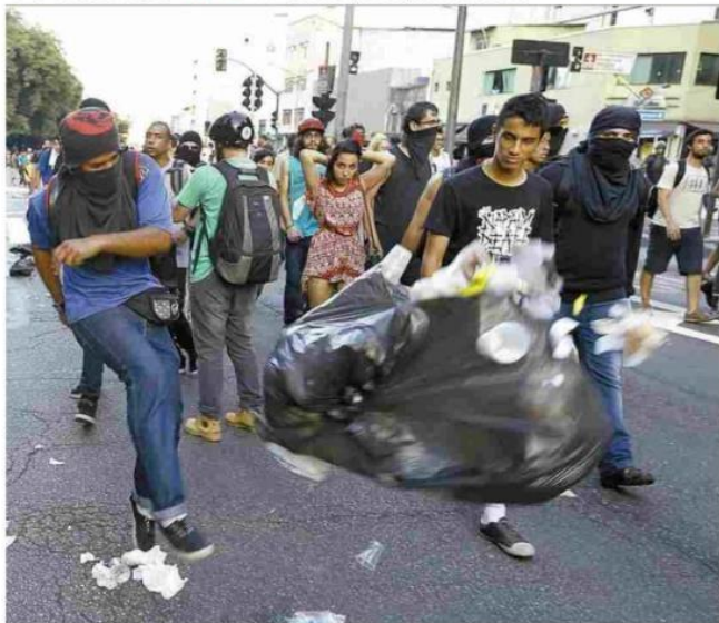
Manifestante chuta saco de lixo durante ato do Movimento Passe Livre no centro de SP