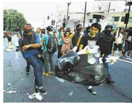
Manifestante chuta saco de lixo na rua da Consolação