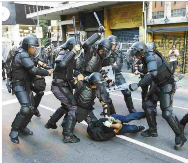
Policiais batem em manifestante durante ato contra o aumento da tarifa de ônibus em SP