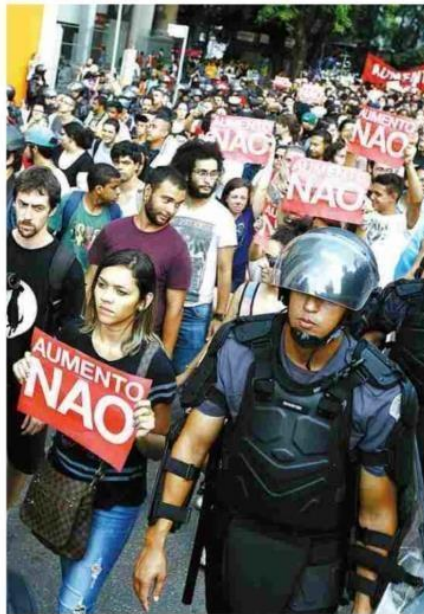
Jovens levantam cartazes contra tarifa durante passeata

As passagens estão mais caras desde terça (6), quan-