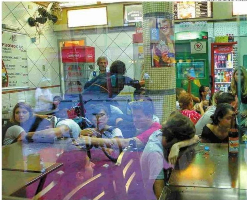
Clientes se abrigam em bar na rua Matias Aires durante a confusão no protesto contra o reajuste de tarifas do transporte