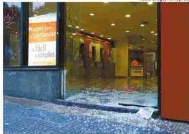
Agência de banco depredada na rua da Consolação

Estações de metrô fechadas parcialmente > Paulista > Consolação > Trianon-Masp