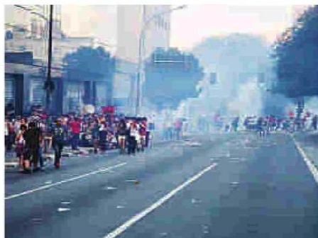
Multidão teve de se dispensar nos momentos mais tensos da passeata