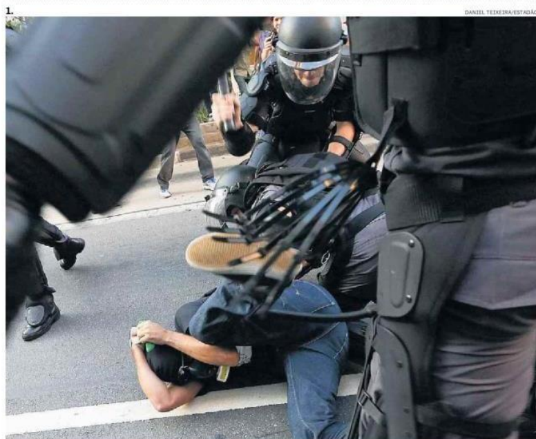
1. Durante confronto com manifestantes, polícia usou bombas e cassetetes; Tropa de Choque tinha câmeras para gravação