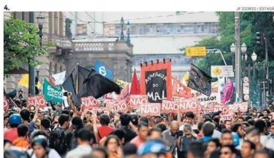
2. Detidos foram levados para o 78º DP e seriam acusados de vandalismo