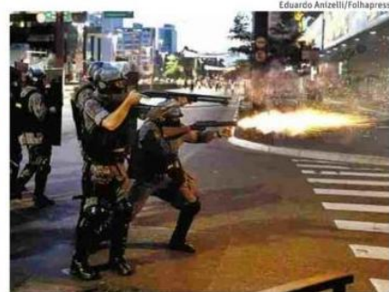
Policiais militares fazem disparos na avenida Paulista