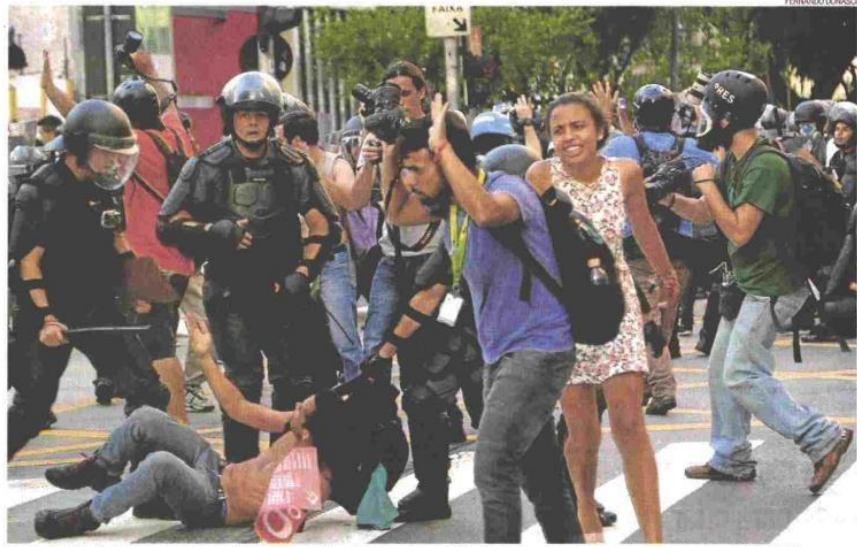
Confusão. Manifestante é cercado por policiais na Rua da Consolação, no Centro de São Paulo; tumulto começou após ataque a carros da Polícia Militar

"Cercar e revistar pessoas indiscriminadamente é um atentado às liberdades e garantias