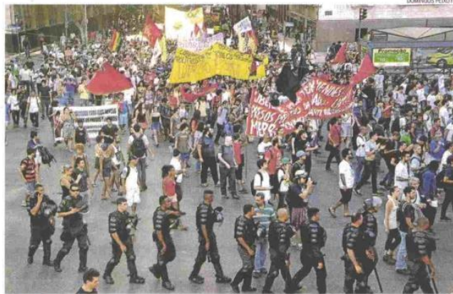
Ato pacífico. No Rio, policiais acompanham manifestação na chegada à Avenida Presidente Antônio Carlos