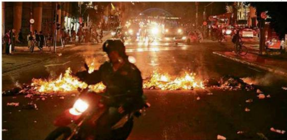
Barricada feita com sacos de lixo em chamas na rua da Consolação, durante protesto dos estudantes na região central

Os PMs reagiram com bombas de efeito moral e de gás lacrimogêneo, o que provocou um corre-corre na região central da cidade, já que cer-