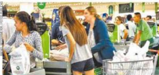
Meio Ambiente - Lei muda a regra de distribuição de sacolas plásticas

As novas sacolas, que começaram a ser distribuídas, foram inspiradas em padrões internacionais e podem ser replicadas em outras localidades do País.