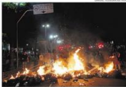
Fogo. Barricadas de lixo foram montadas nas vias

Godofredo Furtado, em Pinheiros, na zona oeste da capital, reclamou da ação da polícia e também lamentou a confusão.