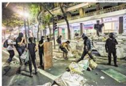
Destruição. Black blocs depredam ruas no centro