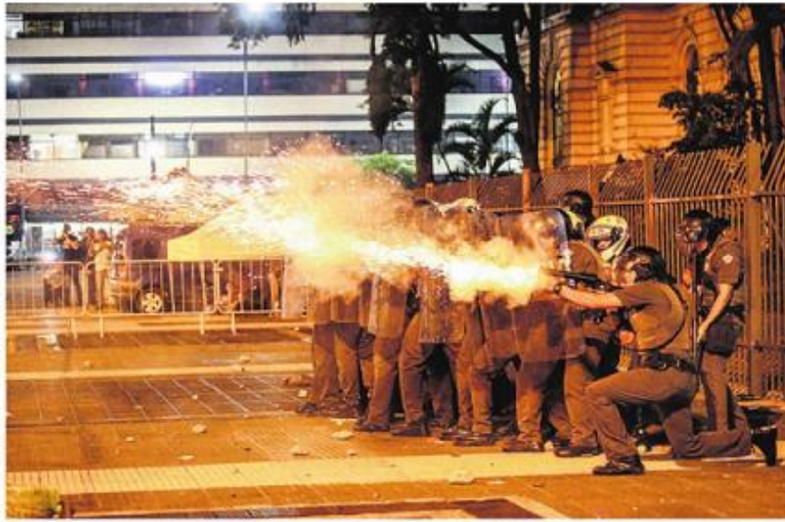
Cerco. Tropa protegeu a sede da Secretaria da Segurança, na República; PM diz que teve 8 agentes feridos