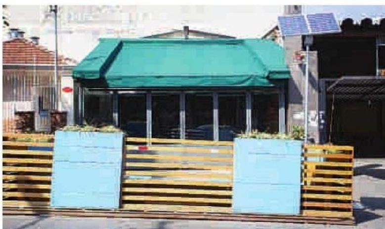
Painel solar possibilita carregar o celular no parklet: tomada para carregar bateria de celular é atrativo ao local

Os parklets beneficiam até 300 pessoas diariamente, enquanto as duas vagas de estacionamento seriam usadas por 40 pessoas. O comércio comemora o aumento no movimento de clientes – em média, o crescimento é de 14%. Os parklets são totalmente gratuitos para a população, que ganha um espaço para descansar ou conversar e aproveitar melhor a própria cidade