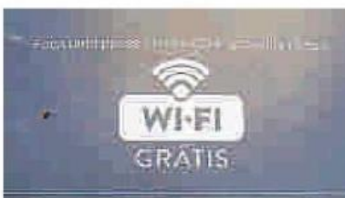
Parklet pode oferecer serviços gratuitos, como wi-fi