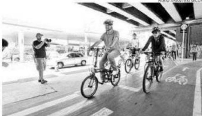
Mesmo sob protestos, Fernando Haddad inaugurou a ciclovia

No local, Haddad encontrou um grupo de moradores que, com cartazes e faixas, pediam o fim do Minhocão, alegando sofrer transtornos por causa da poluição e do barulho do trânsito. “Essa iniciativas são importantes para chamar atenção para o debate”, afirmou o prefeito a uma das ativistas, antes de se dirigir para coletiva de imprensa.