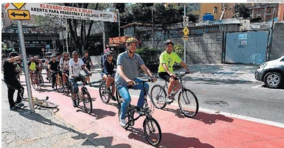
Bike no Dia dos Pais. Após inauguração, Haddad pedalou até Food Park próximo da Estação Marechal Deodoro do Metrô

Enquanto Haddad falava com os repórteres, dois motoristas passaram pela Rua Amaral Gurgel xingando o prefeito em um intervalo de menos de dois minutos. Imediatamente, os participantes do evento reagiram com vaias. O prefeito continuou falando normalmente,