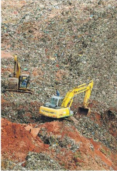
Aprovado. Aterro de Itaquaquecetuba tem nota 7,8

classificação antiga quanto a nova mostram que o IQR é menor em cidades com menos de 100 mil habitantes. Em ambos os casos, a melhor colocação está na faixa de 200 mil a 500 mil habi-