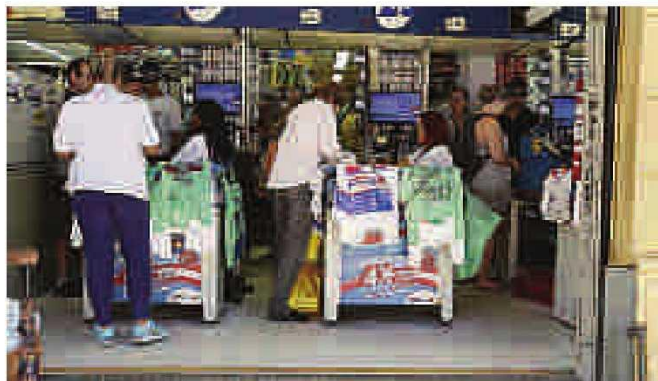
Supermercados estão autorizados a vender sacolas na capital: polêmica

A Prefeitura chegou a contestar a cobrança pelas sacolas,