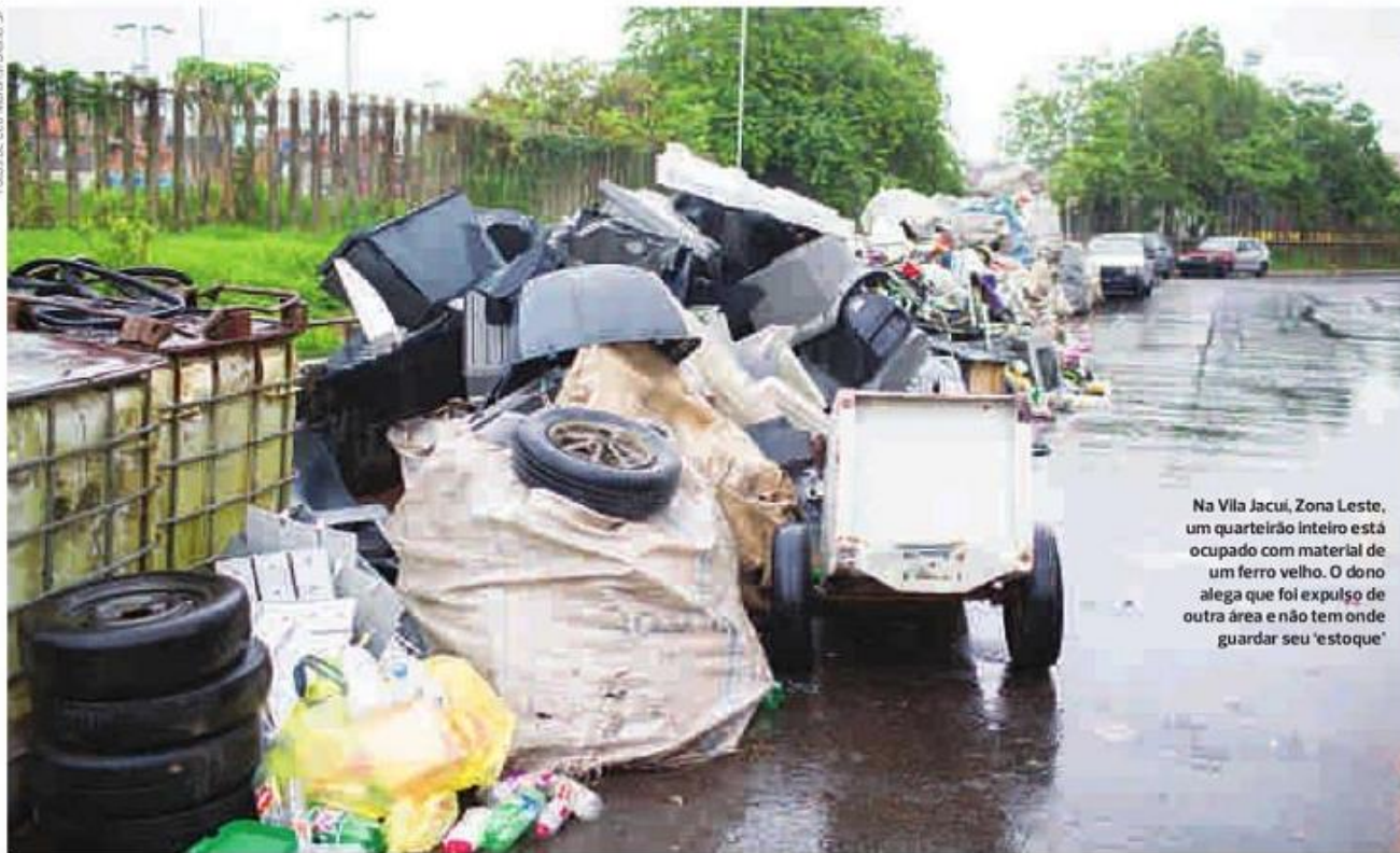
Na Vila Jacuí, Zona Leste, um quarteirão inteiro está ocupado com material de um ferro velho. O dono alega que foi expulso de outra área e não tem onde guardar seu 'estoque'