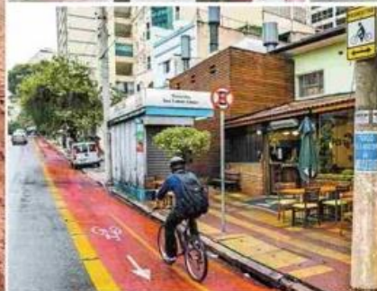
Ciclista passa por ciclovia cheia de lama (à esq.) na av. Bento Guelfi, na zona leste; na av. do Estado (zona leste), água empoçada (à dir., no alto); acima, pista na al. Barros, centro