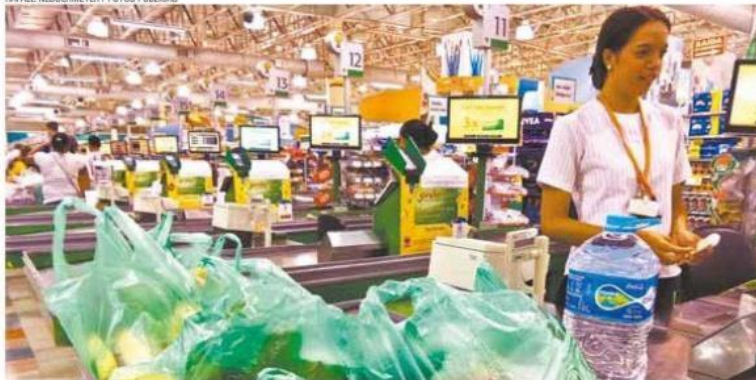
Pode cobrar - Supermercados não precisam fazer doação das sacolas e vão continuar cobrando por elas