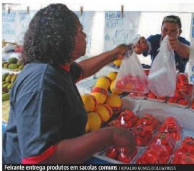
Feirante entrega produtos em sacolas comuns

Dos 96 distritos de São Paulo, 86 têm coleta seletiva, mas em 40 deles ela é feita apenas em parte das ruas. O serviço está disponível para 68% das residências da cidade, segundo o secretário.