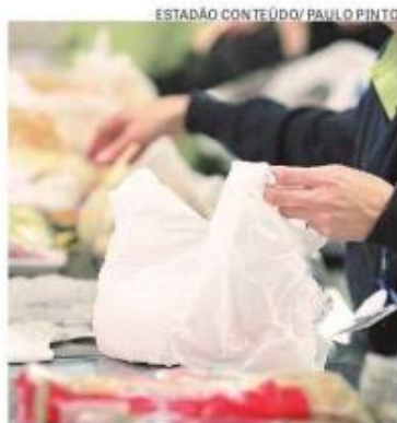
Caixa de supermercado coloca produtos dentro de sacolas

Hoje, a cidade tem duas centrais, as primeiras da América Latina, com capacidade para separar cerca de