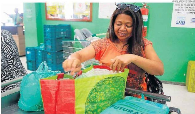
Ainda sem prazo, a Prefeitura pretende padronizar também as sacolas que poderão ser usadas para lixo orgânico (na cor marrom e com material biodegradável) e indefinível (cinza,

Ainda sem prazo, a Prefeitura pretende padronizar também as sacolas que poderão ser usadas para lixo orgânico (na cor marrom e com material biodegradável) e indefinível (cinza,