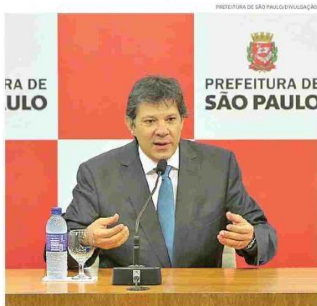
Para o prefeito Fernando Haddad (PT) troca demanda uma 'reeducação'

A sacola verde não poderá ser usada para colocar itens como restos de comidas ou papel higiênico. O intuito é que os materiais recicláveis acondicionados nela sejam enviados para as centrais de triagem mecanizadas ou ma-