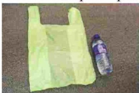
Concede coletiva de imprensa sobre Sacolas Plásticas