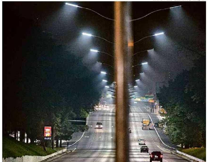
Em 2014, prefeitura trocou antiga iluminação da avenida por lâmpadas de LED