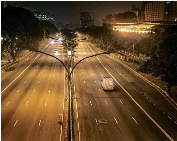
Av. 23 de Maio, em São Paulo, iluminada pelas antigas lâmpadas de vapor de sódio