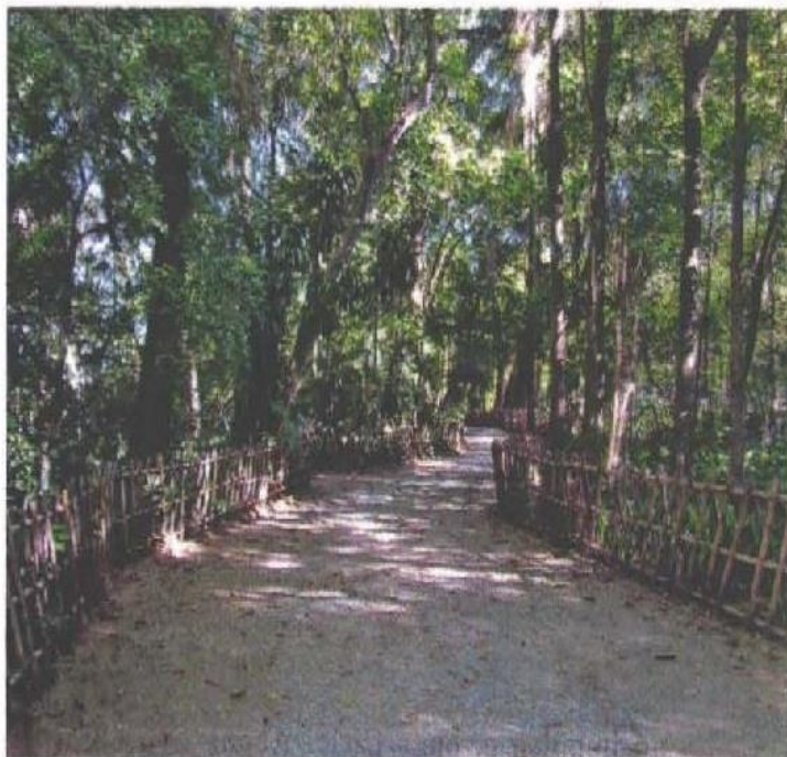
Frequentadores do Parque reclamam da escuridão à noite