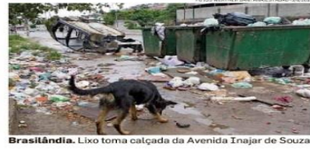
Brasilândia. Lixo toma calçada da Avenida Inajar de Souza