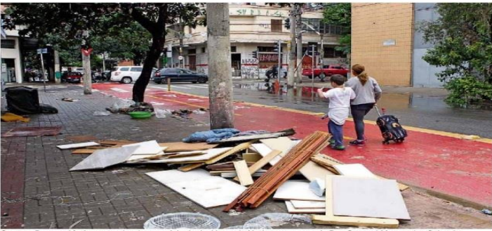
Centro. Paus e plásticos na calçada e na ciclovia da Alameda Nothmann, perto da Rua General Marcondes Salgado