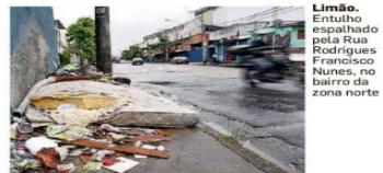
Limão. Entulho espalhado pela Rua Rodrigues Francisco Nunes, no bairro da zona norte